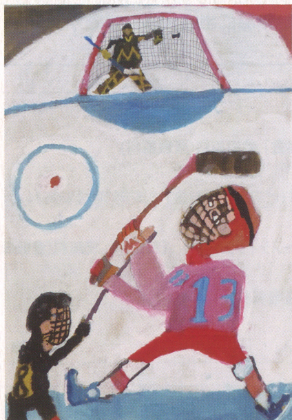
フィールド・マックス「シュートの瞬間」 青森県おいらせ町立木ノ下小学校5年(全国児童才能コンテスト)

常設展観覧料のみで鑑賞可 ◆常設展観覧料: 一般500円(400円)/高校生100円 中学生以下と65歳以上のニセコ町民は無料 ※( )は10名以上の団体、JAF割引料金 ◆年間パスポート: 一般800円、高校生200円(発行日から1年間有効)