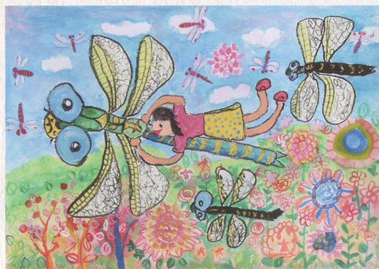
本多 飛香「トンボといっしょに空のたんけん」 福島県塙町立笹原小学校3年 (WE LOVE トンボ絵画コンクール)