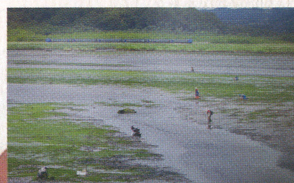
グランプリ受賞作品 伊藤正和「潮干狩り日和」