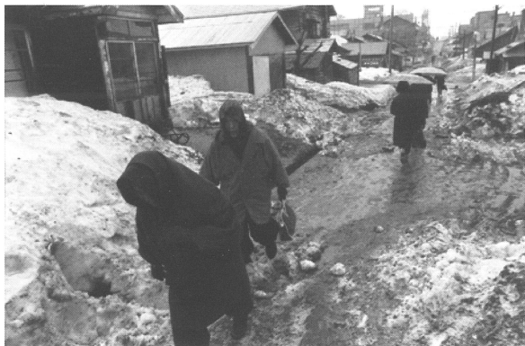
前川茂利 ニセコ町市街地 1965(昭和40)年