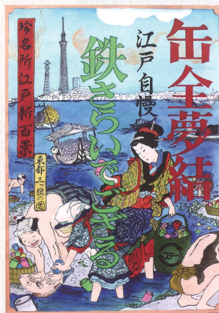
長尾 光倫「缶全夢結」埼玉県西武学園文理中学校3年 (スチール缶リサイクルポスターコンクール)