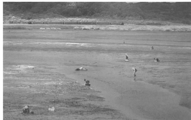
グランプリ受賞作品 伊藤正和「潮干狩り日和」