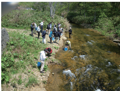
オビラメの稚魚の放流