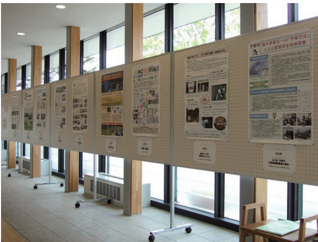
わがまちの政策自慢 ポスター展示