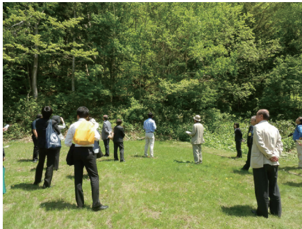
ニセコ町近藤地区水源保全地域