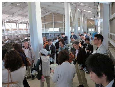
ニセコ町一般廃棄物最終処分場