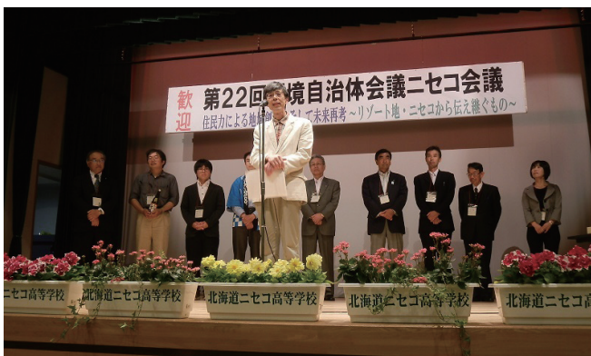
わがまちの政策自慢表彰式