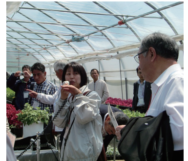
ニセコ高校農業ハウス