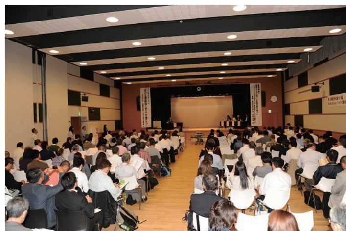
パネルディスカッションを聞く参加者