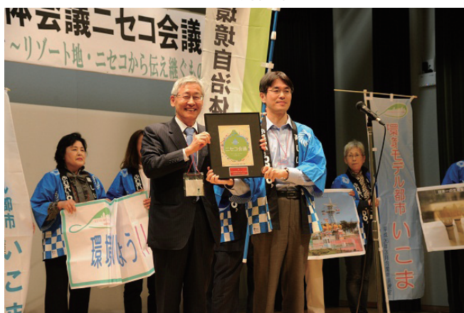
ニセコ町から生駒市へバトンタッチ