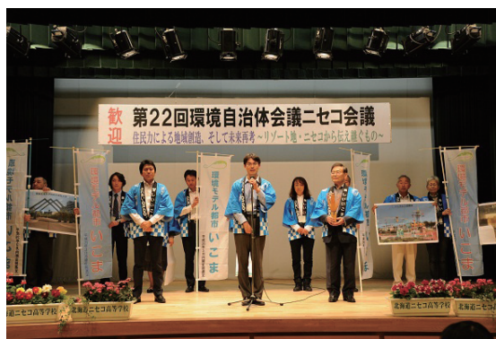
次期開催地 奈良県生駒市のあいさつ