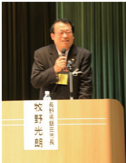
長野県飯田市 牧野市長