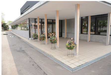
町民センター入口