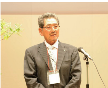
二セコ町議会 猪狩副議長