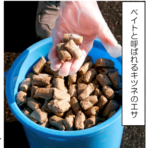
ベイトと呼ばれるキツネのエサ