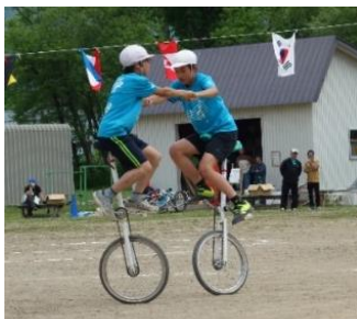
近藤小学校運動会