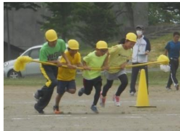
ニセコ小学校運動会