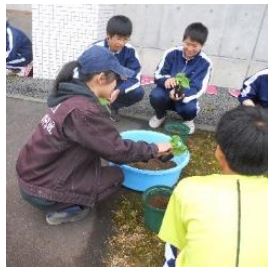
ニセコ中・ニセコ高 交流学習