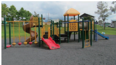
ちびっこ広場 Chibikko Hiroba Park

● Child-Rearing Counseling by a Public health nurse is also available. Further details are listed on Pg. 18 of this guide. Town office hours: 8:30am to 5:15pm, during weekdays. Closed during public holidays.