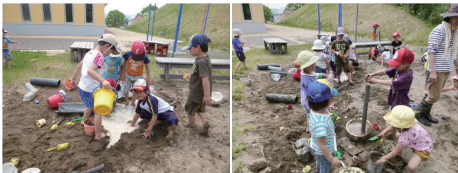
ニセコ町幼児センターきらっと Niseko Town Child Support Centre (Kiratto)

The application period for Kindergarten or daycare is November 1st to November 30th (on an annual basis).