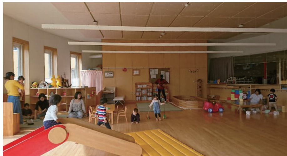
子育て支援センターおひさま Niseko Town Child Support Centre (OHISAMA)

※企画によって託児(無料/先着順)有り ※Childminding availability is on a first serve basis.