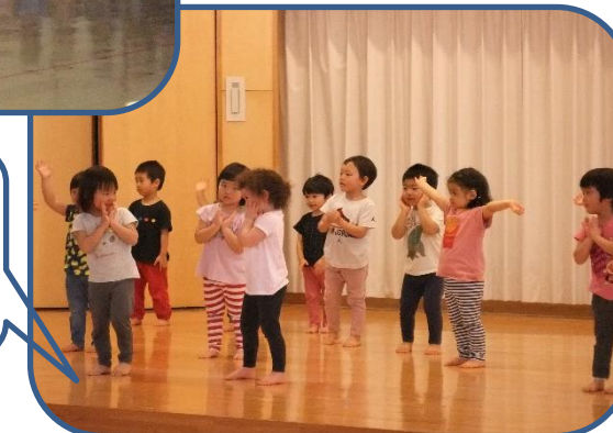
うさぎさんがかわいいダンスを披露してくれました。