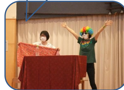
マジックショーに謎の人物が登場！ 素晴らしいマジックにみんな大喜びでしたよ！