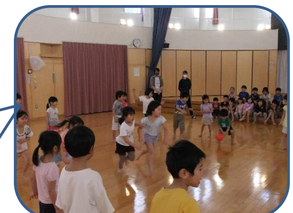
お別れ会の後、ひつじさんとくまさんでドッチボール対決！結果は・・・くまさんが勝ちました！！