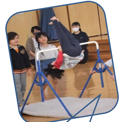
年長児特技披露 鉄棒「逆上がり上手でしょう！