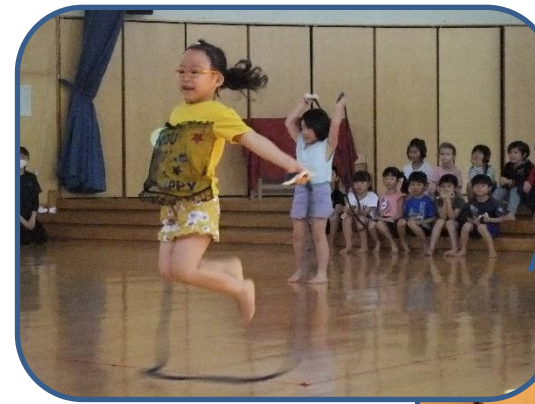
年長児特技披露 自分で編んだ縄で跳びます