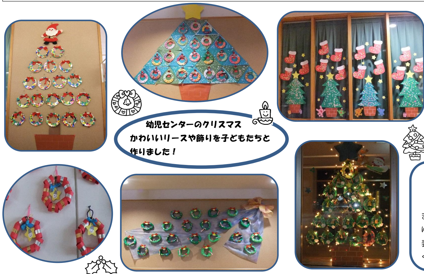
幼児センターのクリスマス かわいいリースや飾りを子どもたちと 作りました！