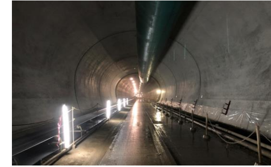
トンネル二次覆工打設済状況