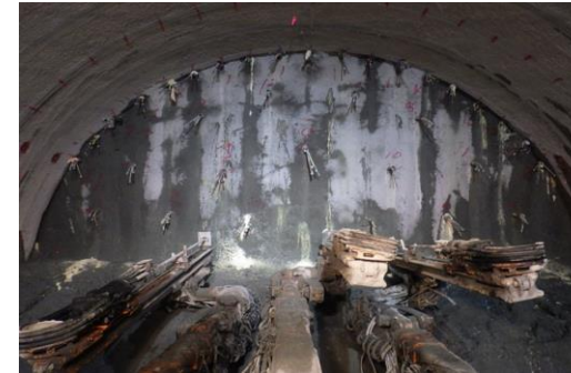
掘削補助工施工状況