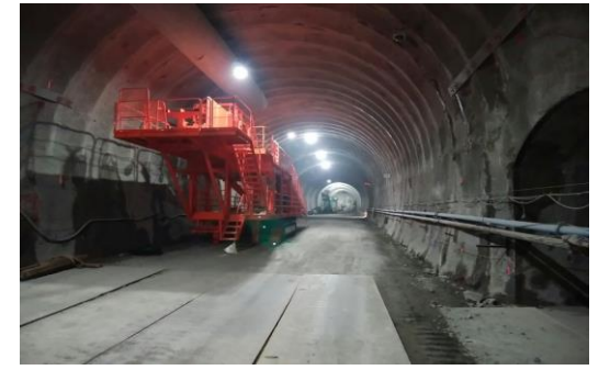
坑内ベルコン設置状況