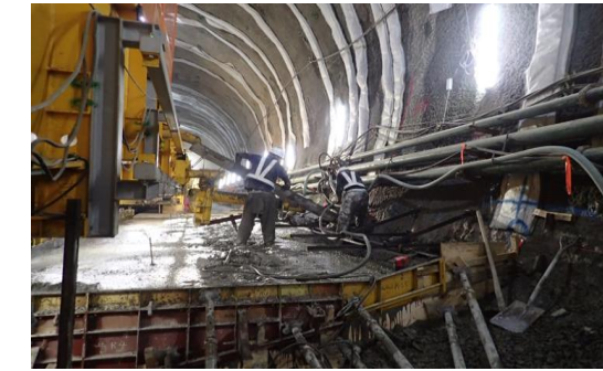
インバートコンクリート打設済状況