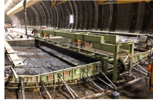
インバート型枠設置状況