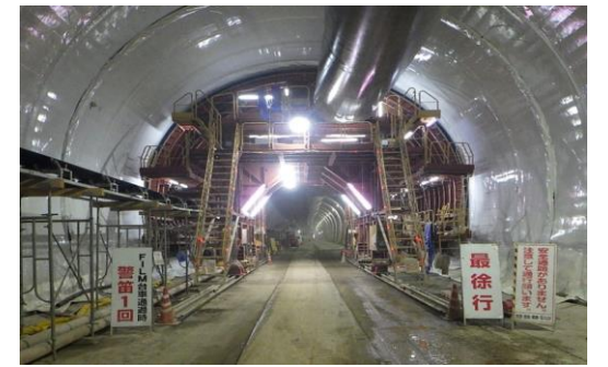
トンネル防水工設置済状況