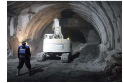
路盤の内トンネル工事進捗状況