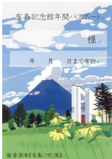
「有島に吹く風」(藤倉英幸・画)