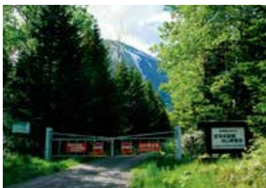
喜茂別コース登山口 Kimobetsu trailhead

The 4th station is close when you pass 800 m and there's a ridge to your right. Watch your step as due to collapses in the valley on the right side, some areas are unstable. Towards the 6th station (1,200 m) the view will improve and you will be able to see all of Mt. Shiribetsudake. The trail then steepens and zig-zags. The trail by the 8th station is unstable towards the right valley. Please walk with caution. The final steep, rocky slope will lead you to the southern crater wall. The top of this formation is the highest point.