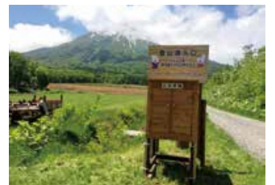
京極コース登山口 Kyogoku trailhead

The trail steepens around 1,000 m, right around where Erman's Birch are abundant. From the 7th station the trail will zig zag. Around 1,600 m there's a viewpoint where you can see various mountains around the Sapporo outskirts. Beyond this point, the trail's rockface is unstable in areas. Watch your step. As you continue to climb and enjoy the mountaineous flora, you will approach the peak - follow the fork to the left to reach the highest point.