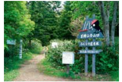
真狩コース登山口 Makkari trailhead

The trail steepens and zigzag after the 4th station. From the 8th station (1,600m), the trail passes around the ridge stretching from the peak to the southwest and over a rocky and dry valley. Ropes are provided, though be aware of unstable slope. Alpine plants are abundant around the 9th station. At the fork, the left path leads you to the mountain hut and the right path leads you to the col of the large crater wall. Tread carefully on the barren rocky southeastern crater wall.