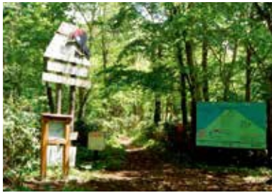
倶知安ひらふコース登山口 Kutchan Hirafu trailhead

The trail is relatively gentle at first, then steepens after 20-30 mins. A wind cave is at the 1.5th station after the slope becomes slightly gentle. The 7th station is located after passing through a tunnel of creeping pines. Watch your step on the scree slope after the 8th station. At the 9th station fork, both the right path via the mountain hut and the left path via Kitayama lead you to the peak.