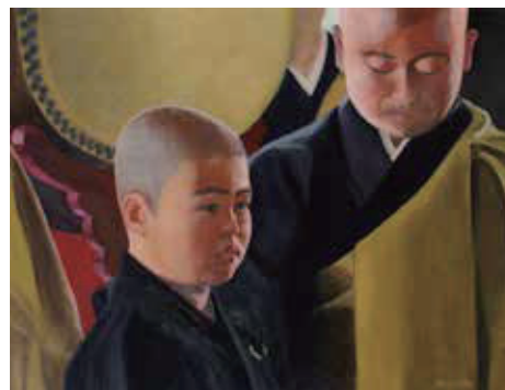
《得度》中学油彩 野村 英春 増毛町立増毛中学校1年