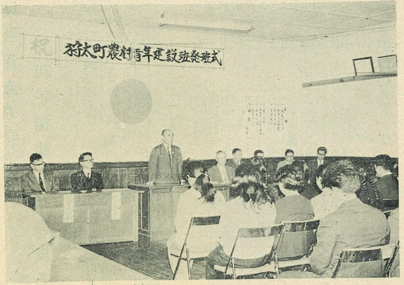
……農協瀬戸組合長から 祝辞を受ける班員一同……

町づくりの一環として、かねてから発足の機運にあつた農村青年のグループ活動としての農村青年建設班は、六月十二日道、支庁、町内各関係者を町議事堂に迎え、誓いも高らかに青年二十八名によって発足しました。 この建設班の特色は、同じ地域の青年が、同じ目的で共同生活を営み、共同の作業に従事し、共同の学習を長期間にわたつて、計画から実施まで自主的に青年自らの手で行なわれる完全なる青年だけの独立した生活環境の中で、これからの農業経営や農村社会生活、そうして農業人としての人間形成の問題を討論し、研修することによつて、将来の明るい希望と確信を身につける修練の場所が農村建設班です。 この合宿訓練により、わが家の農業経営を正しく判断することができ、自治体という地域社会全体を基盤に責任ある活動を行うことにより、今までの自己本位