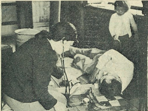
写真は保健婦による指導(更新で)

四十才以上の働きざかりの年齢に多い慢性的病気で、高血圧(脳卒中)悪性新生物(がん等)および心臓病を総称して成人病といつております。この発病を予防するため一般的に、身体に気をつけて、健康に、そして職場を明るく、家庭を楽しくするように努めましょう。そのために年に一度は健康診断を受けましょう。自分のためにも、また家族のためにも次のことさらに注意しましょう。