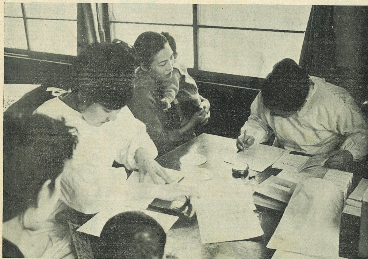
— 幼児健康相談 —