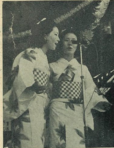
ニセコ観光音頭を唄うすずらん姉妹