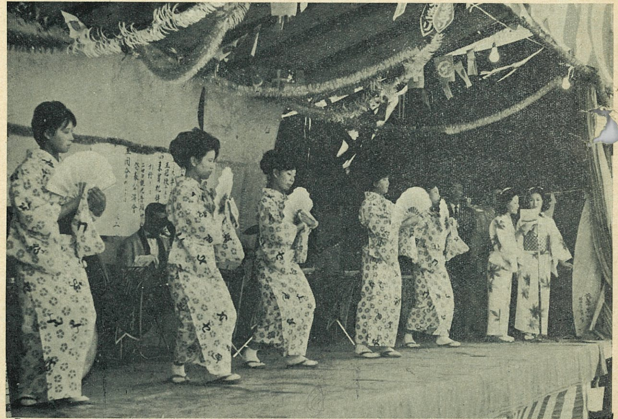
ずずらん姉妹の唄でニセコ観光音頭を披露する