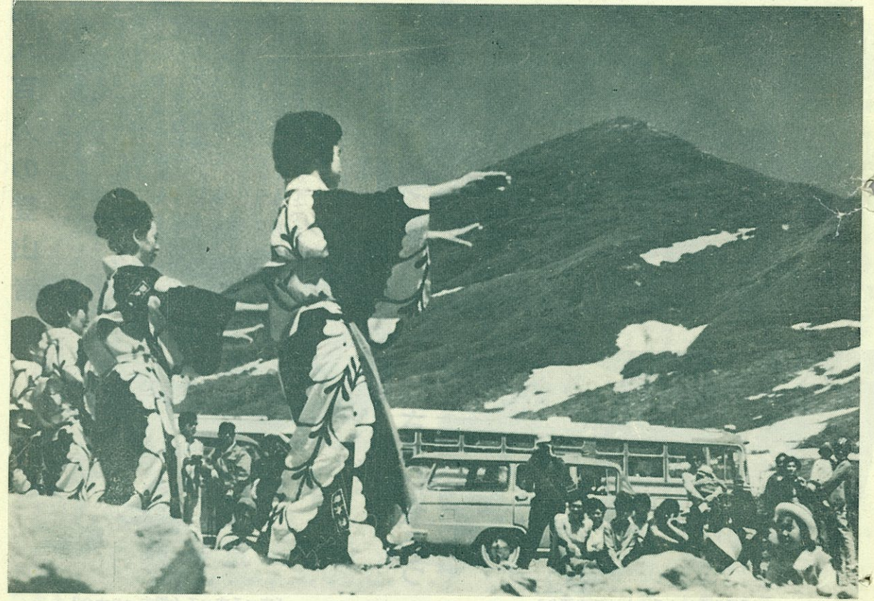
休憩所からニセコアンヌプリを望む