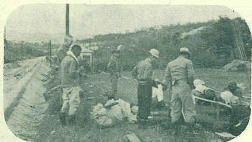
【昆布部落の苗床を視察中】

現在の選挙人名簿制度は「定時名簿」(毎年十二月二十日に有権者を登録確定し、一年間有効とする基本名簿)と「臨時名簿」(選挙資格者を追加補充する補充名簿)との併用であつて、異動しない人も含め、満二十才以上の有権者を毎年調査して基本名簿を作り直し、さらに選挙のたびごとに補充名簿を作つていたのです。このようなことは、