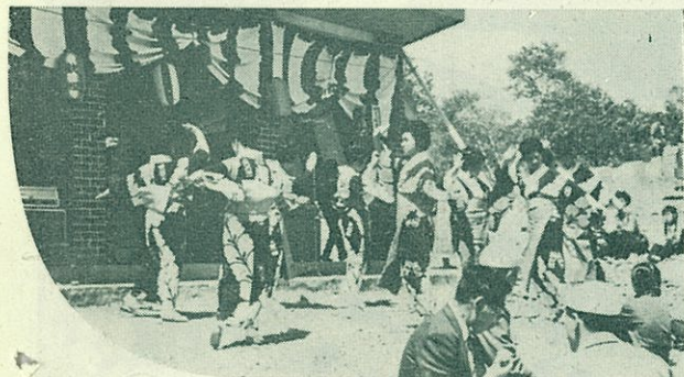
【婦人会によるニセコ観光踊り】