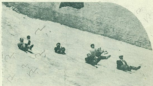
【すべるすべるの雪すべり大会】