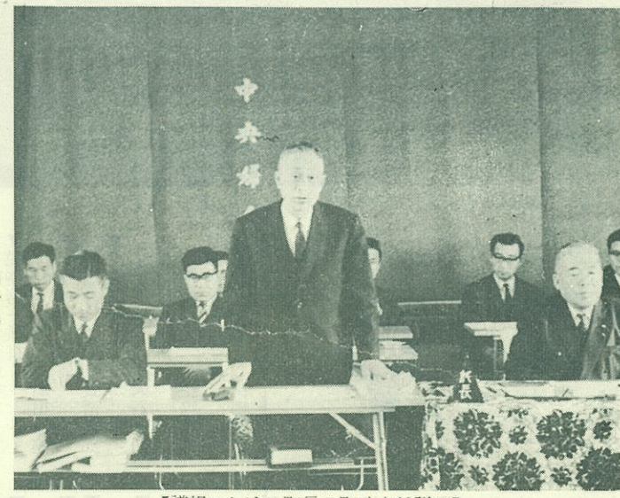
【議場における町長の町政方針説明】

がその引継ぎをなして近代化の施設をすることになりました。運営は、利用者が施設費半額を負担し、残額は町費負担として町が行なうもので、新役場庁舎の使用時期に併せて完成する方針であります。