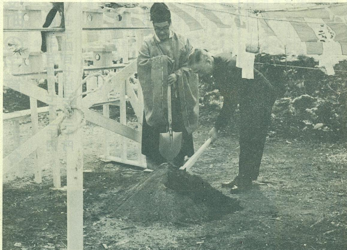
【写真説明】 新庁舎建設起工式の鍬入を行う町長