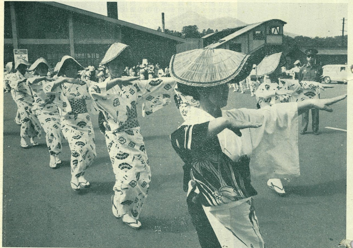
ニセコ観光まつり