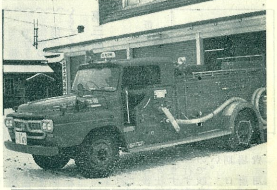
12月10日入車したこのポンプ車は、本町初めての水槽付で、シャシーはイヌマ、ポンプは森田式です。積載水量は3Kℓ、放水時間約6分ですので水利の悪い所に威力を発揮します。価格は360万円、自衛噴霧装置付、なお冬期間は凍結するため水は入れておりませんので普通の消防自動車の活動をします。