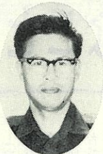
ニセコ本通警察官 派出所 派 出