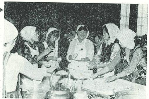
青年会議ではおもしろいサービス