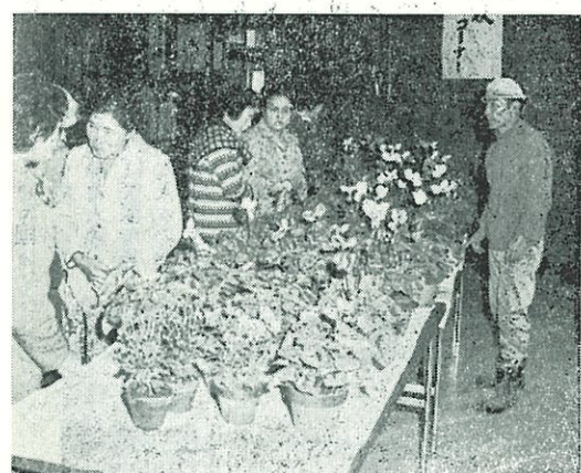
あまい香りがただよふニセコ高校の花コーナー