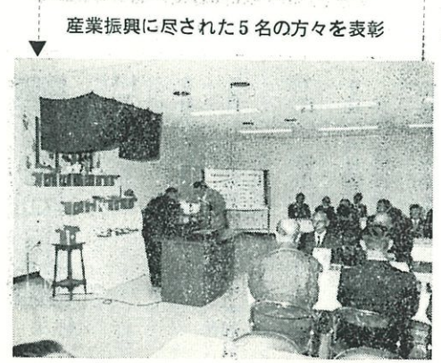
産業振興に尽された5名の方々を表彰