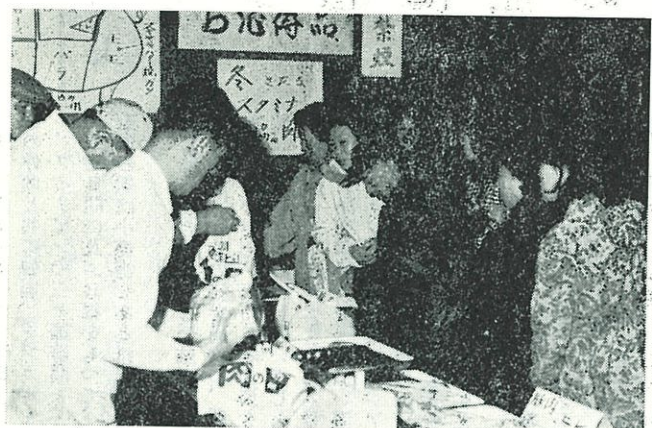
毎回、評判なのは、農産物の展示即売

ことしの産業まつりは、長期の好天の秋日和に恵まれ、農作業も一段落ついた11月10日、ニセコ町民センターで開催されました。 この日は、収獲感謝祭のあと町産業振興に貢献された方々の表彰式、町長の挨拶に続いて、後志支庁長など来賓の祝辞がありそして、今後ともニセコ町の特性を活用した産業振興をめざし共に学び、共に協同して、生活を豊かにしようとする謝辞などがあり産業まつりの開会式は終了しました。 一方、展示会場には、これまでの産業活動の成果品として、丹精込めた盆栽、庭木草花、また夏に心の憩の場となつた、各家庭の花壇のカラー写真など、また、商品展示では、農産物、畜産物、菓子コーナーなど即売を兼ねて数多くの出展、さらに特設食堂、映画会など、多数の方のご利用をいただき、有意義に終了しました。