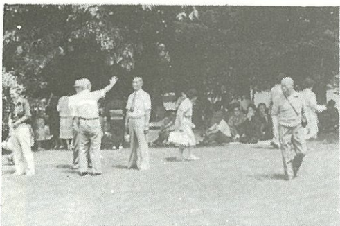
〈知事公館の広場で〉

きて(脂肪肝)長い年月のうち細胞が変性肝硬変に移ることはたしかです。これを防ぐには酒を飲みすぎないことも大切ですが、同時にサカナを大いに食べることも。特にタンパク質が不足すると肝臓に脂肪がたまりやすくなるので、飲む時は肉や魚などタンパク質の豊富なものを十分食べることです。ミンをなめなめ酒をあおるといった飲み方は肝臓には自殺行為であることとを肝に命じてください。