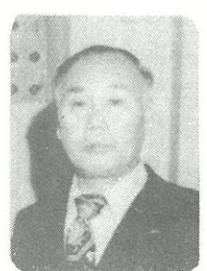
相談内容の秘密は固く守られます

11月23日は、勤労感謝の日です。「勤労をたつとび、生産を祝い、国民たがいに感謝し合う」という趣旨です。勤労という場合、農業、工業その他あらゆる仕事、働きをさすわけですが、折から秋の実りのシーズンでもありますので、やはり農業とかかわることを忘れることはできません。 この日は、かつて昭和24年以前は新嘗祭(にいなめさい)とよばれていました。新嘗祭は、一説によると稲の収穫を祝い、来年の豊作を祈る神事で、いまも宮中をはじめ各地の神社でこの祭りが行われています。新嘗の嘗(なめ)は食べるという意味で、新しいものを食べる、つまり「新穀を食する」儀式ですといつても、いまは稲の収穫が早くなっているために、11月23日に新米を食べるといのは生活実感としてピンときません。戦前は、稲刈りといえ平均して10月下旬から11月にかけて行われたものですが、いまは早いところで8月上旬おそくとも10月上旬には終わってしまいます。 ですから、自主流通米ですと、早いところで8月下旬には配給ルートに乗ります。いうなればそれだけわたしたちは新米を早く食べられるようになったというわけです。 ところが一方で、お米の需要が減り、年々、過剰米は増加の一途をたどっています。お米は、古来より日本人の主食として、また豊富な栄養源として毎日の食生活に欠かせないものでした。わたしたちは、いま一度お米のよさを見直し、国民みなでお米の豊作を祝い、農家の方のご苦勞を共に分かちあえる「勤労感謝の日」にしたいものです。