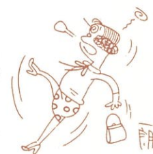
目まい、立ちくらみ

皮膚が毒虫にさされたときのように赤くはれあがり、それがしだいに広まって熱をもち、押すと痛みます。命とりといわれた病気ですが、現在では早く適切な治療を受ければ、悪性でないかぎり全治します。