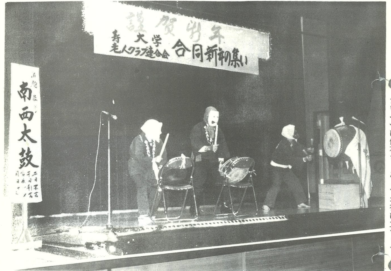
たいせつに保存を あとでお役に立ちます。