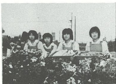
〈学校農園より収穫のある日〉

長いようで、一瞬のうちに過ぎ去つたように思う四年間、その中で、私は他では得られない貴重なものを身につけることができたように思います。 教科はもちろんのこと、いろいろ