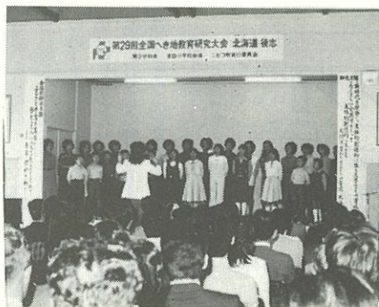
(宮田小の親子合唱)

児童の在籍がなくても、校下の六十二戸が全部PTA会員という暖かい住民の協力が、古老の話を聞く会や感謝祭のもちつき、盆踊りほか、学校をして「ふるさと学習」の実践を公開する大きな支えになつていくことが賞讃される。