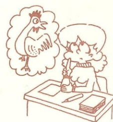
年賀状の差し出し準備を