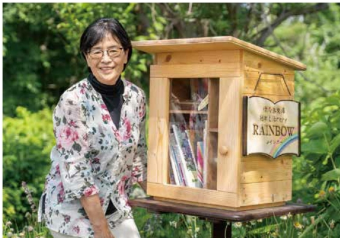
自宅前の絵本箱「マイクロライブラリー」前にて

さあ、展覧会をみたあとは、「ゆき ゆき ゆき」のようにお外に飛び出してゆきとあそぼう！