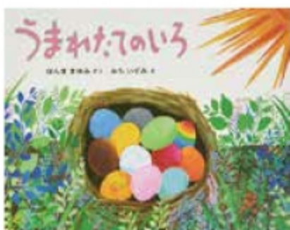
みちいずみ画「うまれたてのいろ」

ほんままゆみ原作「うまれたてのいろ」（みちいずみ画）、「うみがだいすきさ」（みちいずみ画）、「こぐまのはっぱ」（ちばみなこ画）小峰書店より刊行