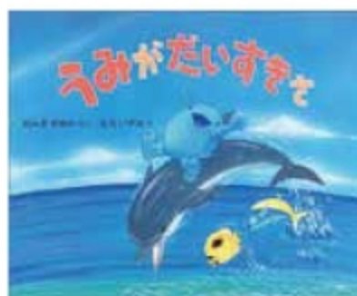
みちいずみ画「うみがだいすきさ」