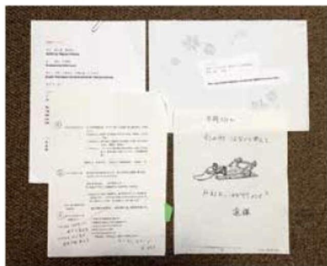
ほんままゆみ創作資料（「ゆき ゆき ゆき」）

北海道札幌市生まれ。ニセコ町に在住。民放局アナウンサーを経て、夫の異動に伴いフィリピン、英国など海外に居住し、移り住んだ先々で絵本よみかせ活動をする。2010年、ニセコ町に移住し、夫と、環境と身体に優しいオーガニックでブドウ栽培・醸造・販売をする「ニセコワイナリー」を営むかたわら、ワイナリーに絵本文庫「ほんま文庫 RAINBOW」を併設。2012年に多言語絵本よみかせ活動を提唱、多様性を認め合う気持ちをはぐくむ活動をニセコ町国際交流員と続けている。絵本原作に「うまれたてのいろ」（みちいずみ画／2003年／小峰書店）、「うみがだいすきさ」（みちいずみ画／2006年／小峰書店）、「こぐまのはっぱ」（ちばみなこ画／2010年／小峰書店）、バイリンガル絵本「ゆき ゆき ゆき」（みちいずみ画／2020年／中西出版）、翻訳書に（本間貞由美、本間浩輔共訳）「あこがれの機関車」（アンジェラ・ジョンソン作／ロレン・ロング画／2008年／小峰書店）、そのほか環境問題を取材した「こむくどりの風によって」（1993年／自費出版）がある。