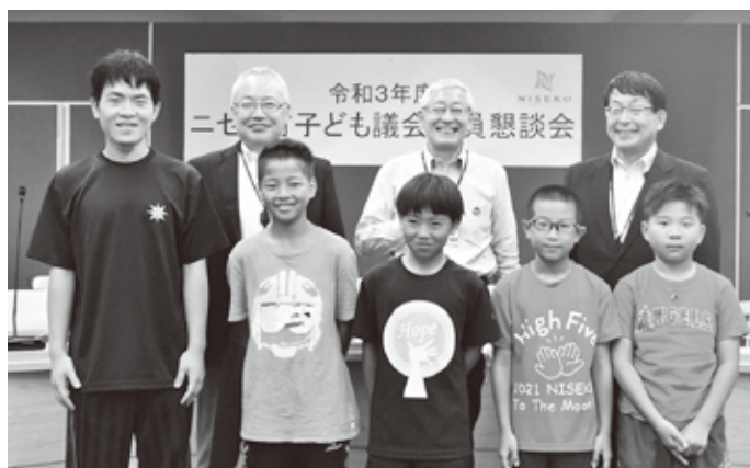
今年度の子ども議員は、ニセコ小2人、近藤小2人、ニセコ高校1人の計5人です

子ども議員からは、「ボールが使える場所の開設」や「自然観光センターの設立」などの提案が出されました。町からは「ちびっこ広場でもボールが使える条件があること」や「五色温泉インフォメーションセンターの存在」について回答しましたが、「今の回答は、ほとんどの人には知られていないので、もっと知ってもらうために周知してほしい」との鋭い指摘も出ました。