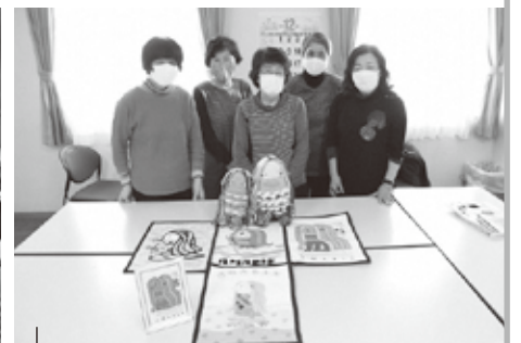
疫病退散を願ってたくさんのアマビエ作品を制作する銀の針のみなさん