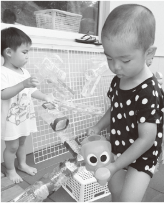
水が冷たくて気持ちがいいよ！