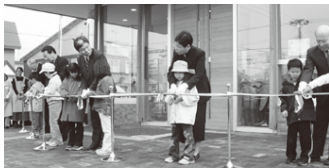
あそぶっく開館時のテープカット

運営に関しては、今まで施設に関して何度も話し合い、苦楽をともにしてきた検討委員でもあった町民にお願いしました。最初は断られました、話し合いを続ける中で、読み聞かせサークルを母体として任意団体「あそぶっくの会」が設立され、平成15年(2003年)4月4日、公設民営の施設として運営がスタートしました。