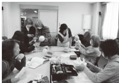
公演に向け、練習を重ねるあそぶっく劇団のみなさん