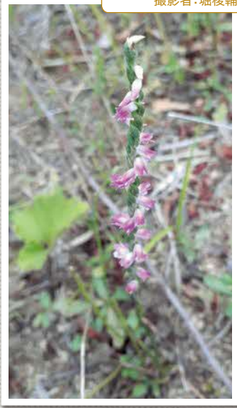
8月上旬 野原に咲くネジバナの美しい情熱アート!(宇富川)

「こんな形の野菜が採れた」「ペットの面白芸」など、身近な写真を広報で紹介してみませんか。撮影日や撮影場所などの簡単な説明とお名前(フォトネーム)とともに、広報広聴係(koho@town.niseko.lg.jp)までお寄せください。