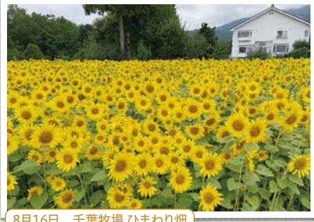
8月16日 千葉牧場 ひまわり畑(宇智我)