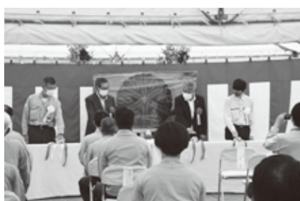
来賓の代表4人の合図によってシールド掘削が開始

羊蹄トンネルは2030年度末の北海道新幹線開通に合わせて令和7年（2025年）に完成する予定です。