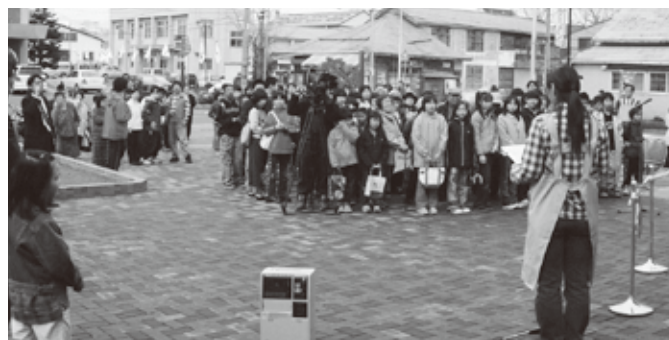
オープン時には多くの子どもたちがかけつけました