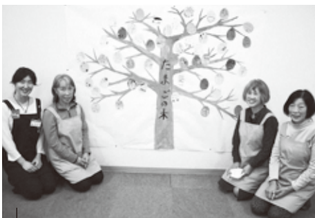
あそぶっくらぶの準備をするスタッフとボランティアのみなさん