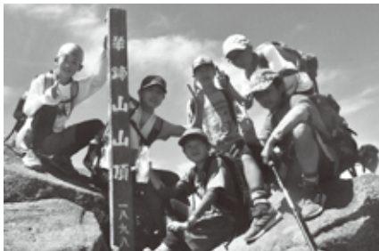
スポーツ推進員、教育委員、協力隊もサポート

連日猛暑が続いていましたが、山頂付近は涼しくらいで、ときおり吹く風が気持ちよく感じられました。