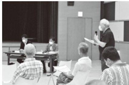
函館線は2030年度末にJR北海道から経営分離されます

参加者からは鉄道の維持を求める声が増え、北海道から示された収支予測だけでなく、実際の利用者や利用時間帯、第3セクターに移行した地域の事例調査などを求める意見や鉄道と観光や農業との連携や防災の観点など、収支だけにとらわれない視点が重要との意見が寄せられました。