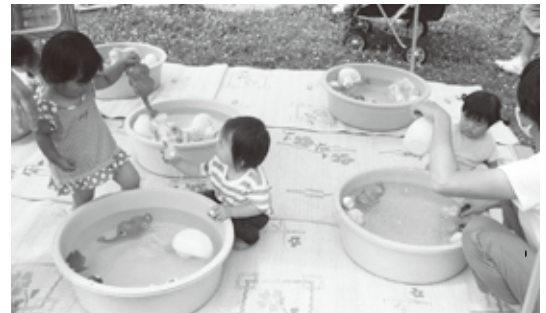
冷たくて気持ちいい！！

2歳のクラスではペットボトルや牛乳パック使い、水車や水路を作って、子どもたちが試しながら遊べる環境を用意しました。未満児のクラスは身近にあるものを利用して水をくんだり、ためたり、運んだり、水の流れを友だちと一緒に楽しみながら遊んでいます。