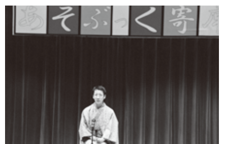
8月4日には蘭越町で子ども向け落語を公演