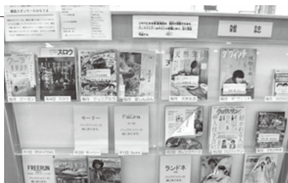
「あそぶっく」では、雑誌スポンサーになっていただける団体・個人を募集しています！ 詳しいお問い合わせは「あそぶっく」(TEL: 43-2155)まで

今「あそぶっく」は、子どもたちの居場所やボランティア活動、地域の人たちの交流の場としての役割のほか、学習や調査のための施設、地域情報が充実した、まさしく図書館としても大きく飛躍しようとしています。 「あそぶっく」は、これからも町民のみならずとも歩み続けます。