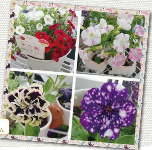
8月中旬 ペランダの花