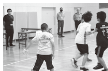
不審者から逃げる！

最初に防犯ビデオを視聴し、その後不審者から逃げる練習を行いました。練習では、不審者に遭遇したら大声を出して逃げることで、子ども110番の家に駆け込み助けを求めることなどを実践しました。