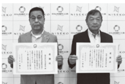
いつもありがとうございます