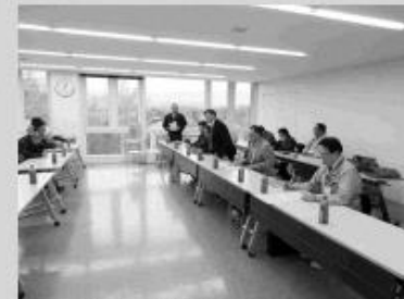
伊達地区期成会の視察のようす

これからも他の地区の視察の受け入れを行い、さまざまな情報交換や交流を深めながら、より良い基盤整備事業になるように活動していきます。