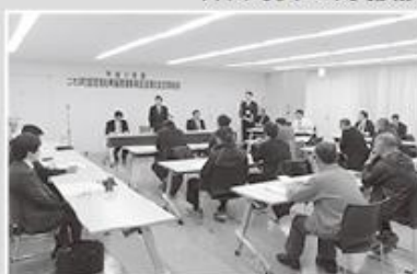
促進期成会総会の様子