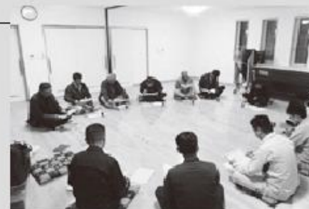
西富地区推進委員会の様子

委員会では、事務局が今年度の報告事項を説明し協議事項を審議。その後、小樽開発建設部が工事の進捗状況や令和7年度に実施する工事の位置を説明。事務局から換地の確定測量に関する説明をし、意見交換や質疑応答の後に、小樽開発建設部で事業完了に向けて整備したほ場の不具合などについて聞き取りを行いました。これからも来年度以降の計画的な事業実施に向けて、中央省庁への要請活動なども実施し、一層強力に運動を推進していきます。