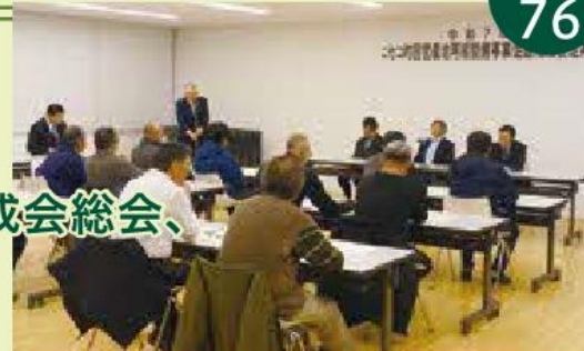
▲期成会総会の様子

今年は、工事が着手されて11年目を迎え、事業も完了に近づいてきます。来年度以降の工事に向け、期成会としてより一層強力に運動を推進していきます。