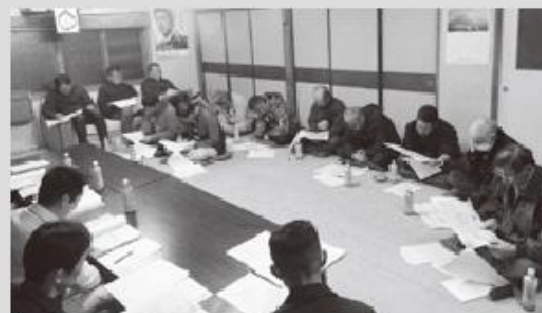
▲宮田地区推進委員会のようす

これからも来年度以降の計画的な事業実施に向けて、中央省庁への要請活動なども実施し、一層強力に運動を推進していきます。