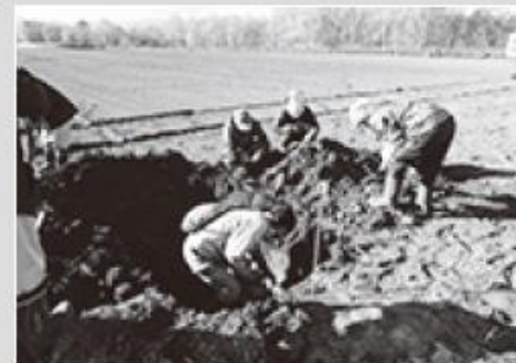
試掘した土の確認