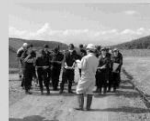
工場現場の見学のようす

教育支援パートナーシップは来年も引き続き行われますので、これからも国営事業の内容を多くの生徒や町民に知ってもらうための広報活動を行っていきます。