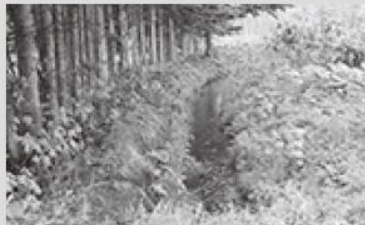
整備前の用水路のようす

国営事業の工事が始まり6年目を迎えています。毎年少しずつ農地が整備されており、計画の3分の1程度の面積が完成しました。今回は水田の整備をする際に欠かせない用水路について紹介します。用水路とは水田に水を入れるための水路です。この水路に水が流れないと稲の成長に大きく影響します。今までの町の用水路は土水路と呼ばれる地面を掘って作った水路が多く、浸透してしまったり、漏れてしまったりして用水をすべて流すことができませんでした。国営事業では、整備区域内の水田と隣接する水路の整備ができるため、すべての用水を流せるようにコンクリート製の水路を整備しています。水の流れも良くなり、流れてきた土砂の撤去もしやすく、利用する農家の維持管理もしやすくなりました。水田も大きくなり作業の効率も良くなりました。今後も工事の進捗とあわせて報告していきます。