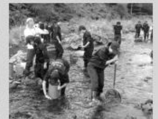
水生昆虫の調査のようす