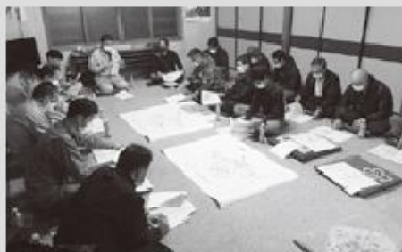
宮田地区推進委員会

委員会では事務局が今年度の報告事項を説明し協議事項を審議。その後小樽開発建設部が、これまでの工事と測量設計業務の進捗状況、令和4年度(2022年度)の工事施工および測量設計業務を予定している位置の説明、換地計画の見直しに関する説明、暗渠排水工の補助工法を説明し、意見交換、質疑応答を行いました。これからも来年度以降の計画的な事業実施に向けて、中央省庁への要請活動なども実施し、一層強力に事業を推進していきます。