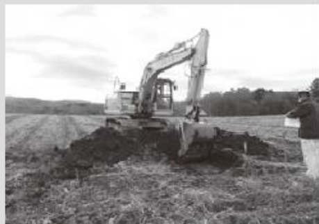
北海道教育庁による試掘断面の確認

調査には、北海道教育庁のほかに、町教育委員会、小樽開発建設部および町国営農地再編推進室が同行し、収穫後の農地で調査を実施します。今後も埋蔵文化財の保護のため、毎年実施していきます。