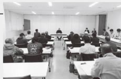
権利者会議のようす

採決では、欠席者以外の賛成多数により換地計画が決定され、今後換地処分に向けた手続きが進められます。換地の処分が終わると、新しい地番に登記がされます。来年は東部工区、再来年は南西部工区と換地処分が続きます。