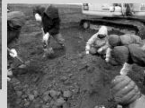
試掘した土の確認