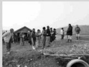
現地での説明のようす

今回の研修で自分たちのほ場を良くするためには、どのような整備をする必要があるのかをイメージできるような研修を行うことができました。