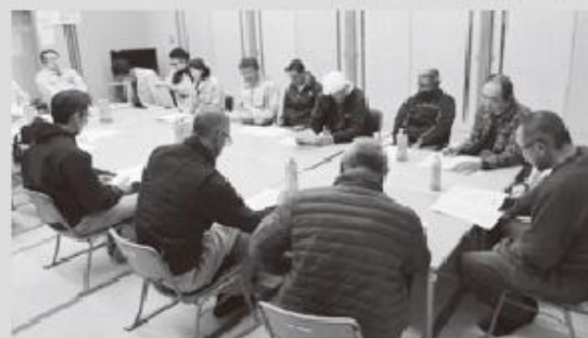
▲近藤地区推進委員会のようす