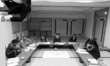
里見・有島・元町地区推進委員会のようす