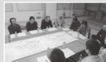
里見地区推進委員会の様子