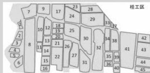
【工事前】ほ場が小さくて形が良くない

ほ場の状況は複数の水田や畑が入り乱れた状態で、ほ場の大きさも小さく形も不整でした。整備は、地形条件に合わせて可能な限りほ場を大きくして、形を良くできるようにほ場の整形を行っています。今後も工事の進捗とあわせて報告していきます。