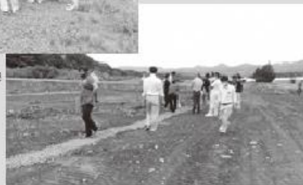
▶暗渠排水 きょ について意見交換

■問合せ/国営農地再編整備事業促進期成会事務局 (国営農地再編推進室内) Tel 0136-44-2121 担当=辻・大久保