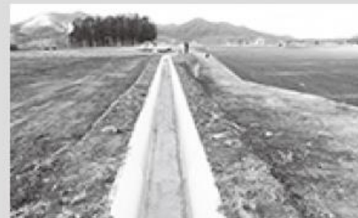
整備後の用水路のようす

■問合せ/国営農地再編整備事業促進期成会事務局 (国営農地再編推進室内) Tel 0136-44-2121 担当=辻・鶴間