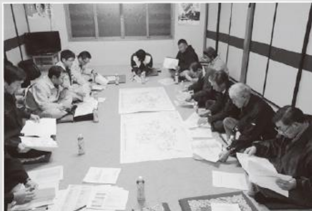
宮田地区推進委員会のようす

今後も来年度以降の計画的な事業実施に向け、中央省庁への要請活動なども実施し、一層強力に運動を推進していきます。