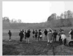
整備ほ場を一望しているようす