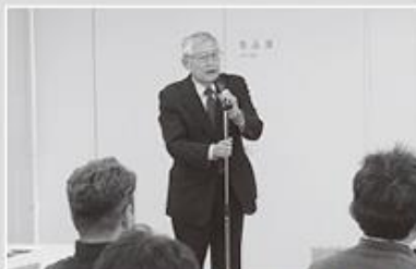
片山町長の来賓挨拶

今年は工事が着手され5年目をむかえますが、来年度以降の工事に向け、期成会としてより一層強力に運動を推進していきます。