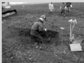
北海道教育庁による試掘断面の確認

調査には北海道教育庁のほか、ニセコ町教育委員会、小樽開発建設部およびニセコ町国営農地再編推進室が同行し、収穫後の農地で調査を実施します。今後も埋蔵文化財の保護のため、毎年実施していきます。