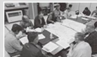
ニセコ地区推進委員会の様子

これからも来年度以降の計画的な事業推進に向けて、中央省庁への要請活動などを行っていきます。