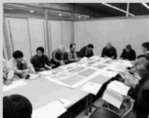
近藤地区推進委員会のようす