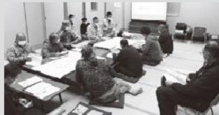
ニセコ地区推進委員会

これからも来年度以降の計画的な事業実施に向けて、中央省庁への要請活動なども実施し、一層強力に運動を推進していきます。