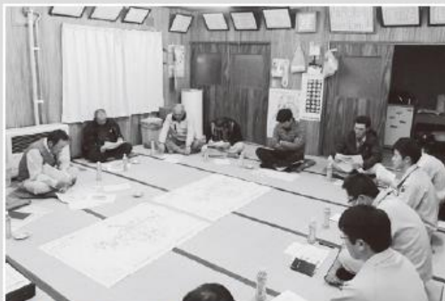
西富地区推進委員会のようす