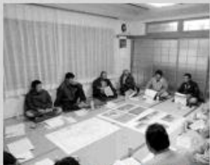
西富地区推進委員会のようす

委員会では、小樽開発建設部から平成30年度に工事の施工を予定しているほ場や今までに課題となっていた内容を検討した結果が説明され、その後、意見交換や質疑応答が行われました。これからも来年度以降の計画的な事業実施に向けて、中央省庁への要請活動なども実施し、一層強力で運動を推進していきます。