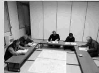
福井地区推進委員会のようす

これからも来年度以降の計画的な事業推進に向けて、中央省庁への要請活動なども行っていきます。