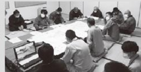
有島元町里見地区推進委員会

■問合せ/国営農地再編整備事業促進期成会事務局 (国営農地再編推進室内) TEL 0136-44-2121 担当 = 辻・鶴間