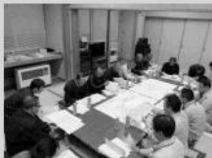
ニセコ地区推進委員会のようす