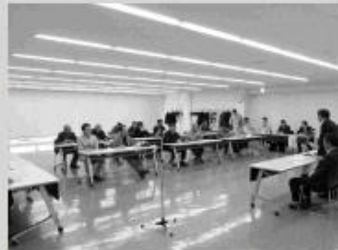
促進期成会総会の様子