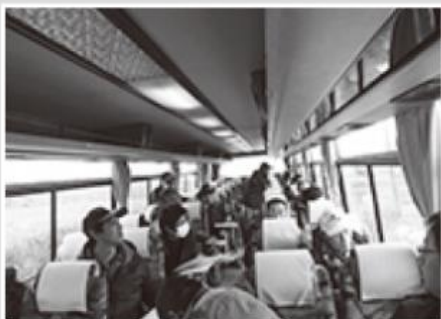
バス内からの説明

今回の視察で自分たちのほ場を良くするためには、どのような整備をする必要があるのかイメージすることができました。