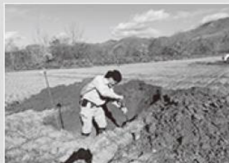
北海道教育庁による試掘断面の確認

調査には、北海道教育庁のほか、町教育委員会、小樽開発建設部および町国営農地再編推進室が同行します。今後も埋蔵文化財の保護のため、毎年実施していきます。