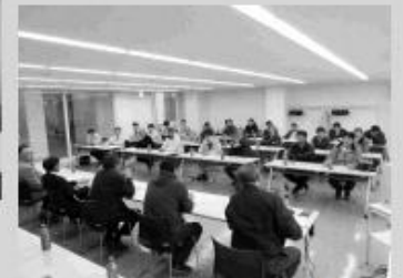
さまざまな意見交換が行われました