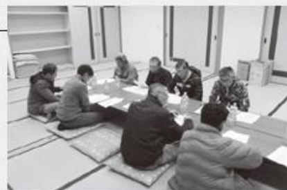
里見・宮田地区推進委員会のようす

事業完了に向けて、中央省庁への要請活動なども実施し、一層強力に運動を推進していきます。