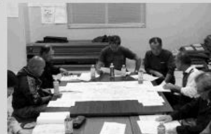
ニセコ地区推進委員会のようす

委員会では、小樽開発建設部から平成31年度に工事の施工を予定しているほ場や今までの事業の進捗、工事や業務で課題となっていた内容を検討した結果が説明され、その後、意見交換、質疑応答が行われました。これからも来年度以降の計画的な事業実施に向けて、中央省庁への要請活動なども実施し、一層強力に運動を推進していきます。