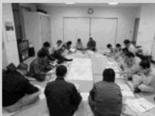
曾我地区推進委員会のようす

これからも来年度以降の計画的な事業促進に向けて、中央省庁への要請活動なども行っていきます。