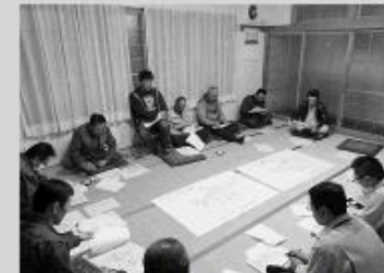
里見地区推進委員会のようす