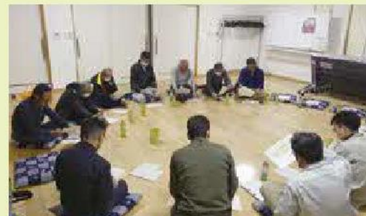
▲福井・西富地区推進委員会の様子