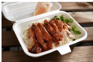
Chicken rice in styrofoam container

By the way, when ordering food to go, in addition to "takeaway", "takeout" and the Malay word "bungkus", the Cantonese word "tapao" is also commonly used. Next time you visit Malaysia and want to get takeaway, be sure to try using these words!