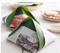
Nasi lemak bungkus

It is nasi lemak bungkus wrapped in banana leaf and newspaper. Nasi lemak is Malaysia's signature dish of coconut rice with spicy chilli paste and other toppings, and bungkus means takeaway. A long time ago, nasi lemak bungkus was wrapped only in banana leaf. However, as banana leaves break and tear easily, nowadays it is wrapped with an additional layer of newspapers or waxy paper.