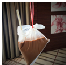
Coffee to-go in a plastic bag

over time. For hot or iced drinks such as coffee, tea or Milo, the drink is poured into the bag, one side of the bag opening tied up with string, and a straw inserted into the open side. In addition, if you get chicken rice, it will usually be in a styrofoam container.