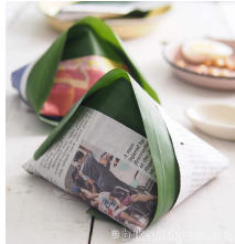
ナシレマツ・ブンクス

バナナの葉と新聞紙で包まれたナシレマツ・ブンクスです。「ナシレマツ」はココナツライスに辛いチリーペーストや卵などのトッピングを添えたマレーシアの代表的な料理です。そして、「ブンクス」はマレー語でテイクアウトを意味します。「ナシレマツ」は昔、バナナの葉だけで包まれていましたが、バナナの葉は破けたり裂けたりすることがあるので、包装を補強するために、新聞紙やオイルペーパーを重ねて使うことが定番になりました。