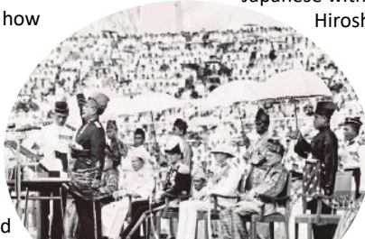
Tunku Abdul Rahman leading the shout of freedom at the Merdeka Square on August 31 st 1957

In 1748, the Kedah Sultanate ceded Penang to the British East India Company in exchange for protection from other foreign threats. With one foot into Malayan land, the British slowly expanded their reign to Singapore, Malacca and by the end of 1869, the whole of Malaya.