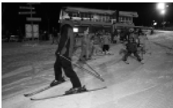
夜間スキー・スノーボード教室の様子