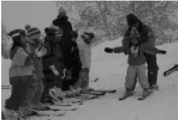
小学1年生スキー教室