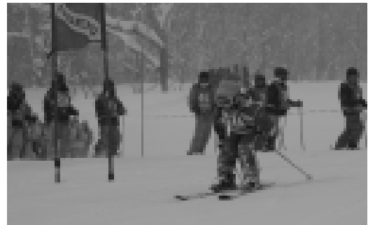
昨年度のスキー大会の様子

主な経費 スキーリフト使用料 40万円 バス借上料 34万円 その他大会開催経費 5万円