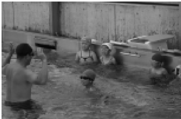
小学1年生水泳教室の様子