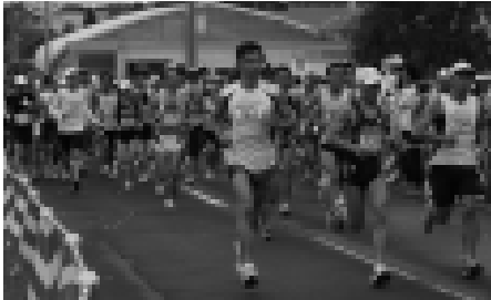
毎年1,000人以上のランナーが町内を駆け抜けます