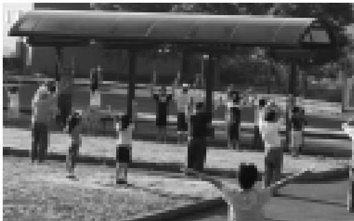
大人から子どもまで参加するラジオ体操会