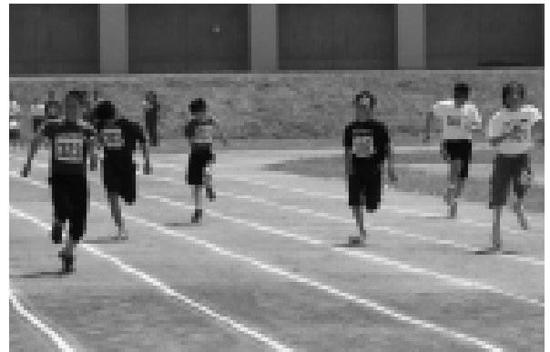
昨年の中学校体育祭