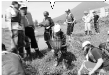
今回は通学路沿いの用水路も調査。普段何気なく歩いている道のすぐ横にもさまざまな生物が住んでいます