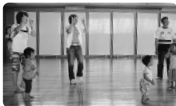
親子スポーツでは、子どもたちだけでなくお父さんお母さんたちも楽しく活動しています

親子スポーツ教室終了後、「親子で楽しく遊びながら友達作りをしよう」をコンセプトに、お母さんたちの自主運営による『親子スポーツクラブ』が始まりました。