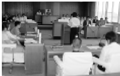
今回参加した10人の議員は、町長や教育長などを前におくことなく、堂々と質問していました

小中学生がまちづくりに参加する取り組みの一つ「子ども議会」が開催されました。一般質問では、通学路の交差点改良や不審者対策など子どもならではの質問から、ニセコ町産野菜の更なるPRや公共施設のバリアフリー化など、町全体に向けた鋭い質問を町長などに問いかけました。