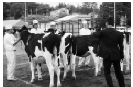
審査員（右）の審査を受ける緊張の瞬間。牛の引き手は牛が大きく美しく見えるよう細心の注意を払います

また、当日は酪農関係者以外にも共進会を楽しんでもらおうと「うしまつり」も開催されました。うしまつりでは、ウサギやヤギとのふれあいや乗馬体験コーナーのほか、乳製品試食コーナーなどが開かれ、子どもからお年寄りまで多くの人が動物たちとのふれあいと酪農の恵みを楽しんでいました。