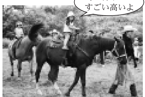
毎年順番待ちの列ができる乗馬体験コーナー。今年も長い列ができていました