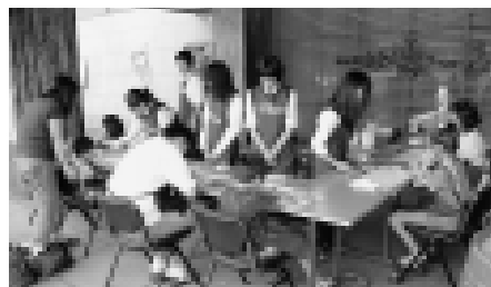
制作体験では、親子連れなどたくさんの方々に楽しんで頂きました

体験はホテルへの宿泊者を対象に行われましたが、参加されたみなさんからは「良い思い出になりました」とニセコに来た記念として喜んで頂けました。