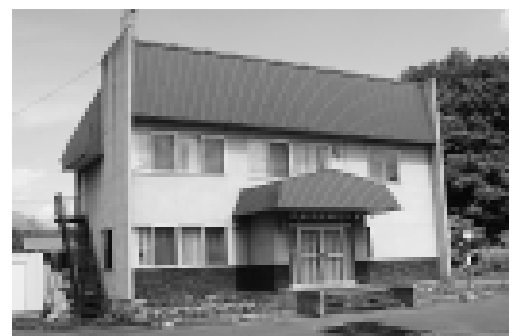
西富地区町民センターでは屋根のほか外階段のさび止め・塗装をします