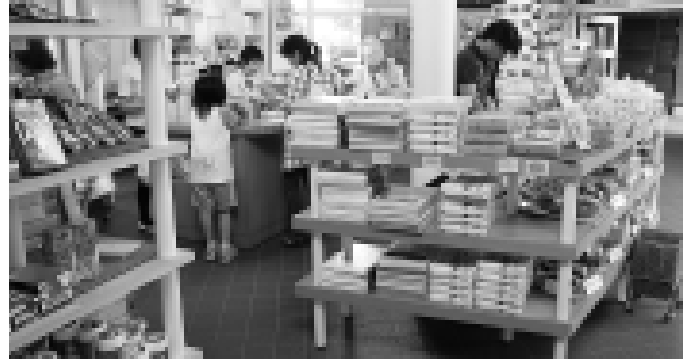
道の駅ニセコビュープラザでは、観光案内と特産品のスペースを広げて、案内カウンターを設置します

町内商店が参画する綺羅スタンプ組合が、綺羅スタンプを台紙方式からポイントカード方式に変更するため、その費用の一部を補助します。