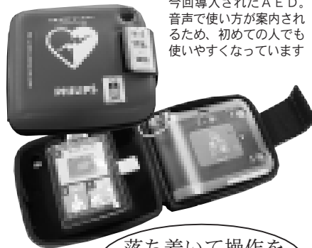
今回導入されたAED。音声で使い方が案内されるため、初めての人も使いやすくなっています

心肺機能が止まった人には、早急なAEDの使用や蘇生法が大変重要ですが、正しい知識や技術がないとその効果は低くなります。みなさんも講習をぜひ受講してください。