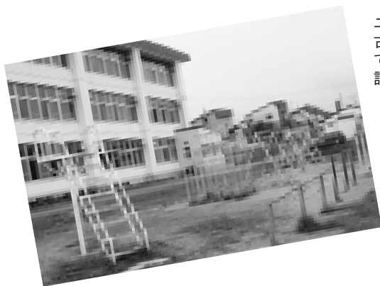
ニセコ小学校では、古い遊具を撤去して、新しい遊具を設置します

陸上競技場の走り高跳び用マットや町民運動場のサッカーゴール、総合体育館のバレーボール・バドミントン用具など、老朽化した体育器具を更新します。