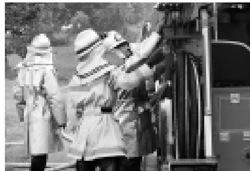
消防職員の防火衣は、軽くて活動しやすいタイプに更新します