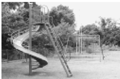
近藤小学校の滑り台とブランコには、着地マットを設置します