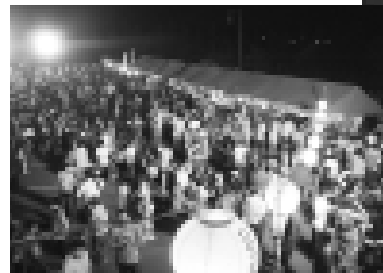
来客も露店も大幅に増えた会場。ピーク時にはなかなか前に進めないほどのお客さんでにぎわいました