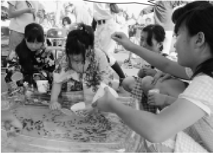
金魚すくいコーナーにはたくさん子どもたちが挑戦。すぐに破れてしまう子もいれば、上手に何匹もすくう名人級の腕を見せる子もいました