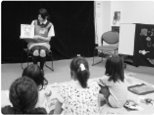
実習に来たニセコ高校生の読み聞かせ 落ち着いた語り口でとても上手に読んでいました