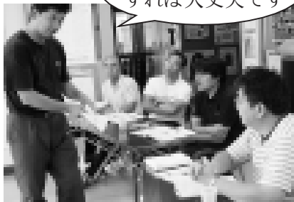
落ち着いて操作をすれば大丈夫です