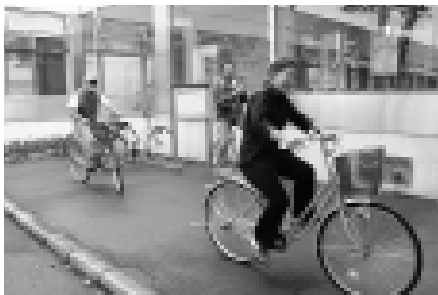
自転車は申込書に記入し、身分証明書を提示するだけでニセコビレッジや綺羅乃湯など町内5カ所でも借りたり返したりできます

自由に利用できる無料貸し出し自転車「ニセコグリーンバイク」の運用が始まりました。この自転車は、車の利用を減らして環境に配慮しながら、車では感じられない町の良さも体感してもらおうと、町内の事業者と町が協力して整備しました。みなさんもぜひ一度ご利用ください。