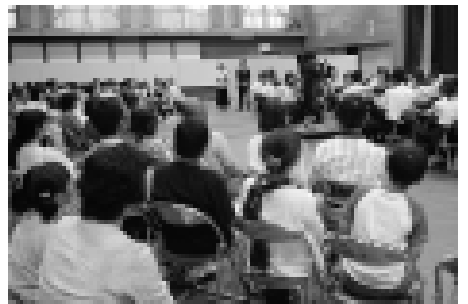
6日のコンサートの途中では、客席から4人の観客が呼ばれて、壇上で指揮者体験も行われました