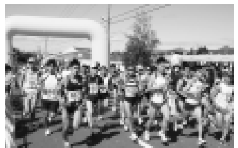
号砲とともに黄色いスタートゲートから一斉に走り出すランナー。ニセコの豊かな自然を感じながら走ったことでしょう

会場の陸上競技場では、地場産品の販売などさまざまなお店が並んだほか、ビンゴ大会などの催しも開かれ、イベントを盛り上げました。また今年も、3年ぶりに「ジャガイモばんば」が復活。参加したみなさんは一致団結して、ジャガイモの入ったコンテナをそりに乗せ、勢いよく引っ張っていました。