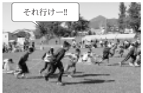
子ども、一般女性、一般男性の3部門で行われた「ジャガイモばんば」では、力のこもったレースが繰り広げられました