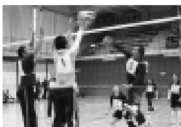
昨年の大会の様子。各試合で熱戦が繰り広げられました