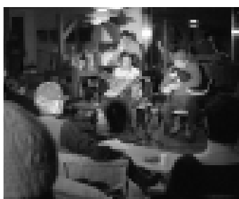
昨年の童話祭。演奏や朗読のほかゲーム大会なども行われました

■対象者／平成元年4月2日から平成2年4月1日生まれの人 ■申込み・問合せ／町民学 習課町民学習係 ☎44・2034 担当＝淵野・佐藤 有島記念館の催し 楽しみいっぱいのお祭り 今回は、ともに10回目を迎える「一房の葡萄祭」と「有島童話祭」を合同で開催します。今年も楽しい企画をたくさん用意しています。