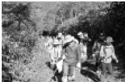
鹿部町からの参加もあったクリーン登山。みなさんは紅葉の進む風景を楽しみながらごみを探していました