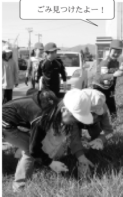
全校児童が参加したニセコ小学校校外清掃では、子どもたちが競い合うようにごみを拾っていました

10月には、1日にニセコ小学校の校外清掃が行われ、学校周辺のほか、本通団地や望羊団地などの周りのごみを拾いました。また、8日に開催された「秋のクリーン作戦」には、町内のさまざまな団体から約30人が参加し、町道羊蹄近藤連絡線沿いのごみ拾いを実施しました。そのほかにも、いくつかの自治会でごみ拾いが行われています。清掃活動に参加したみなさんお疲れ様でした。