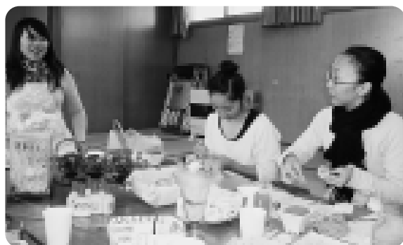
お母さん同士でお話しを楽しみながら作品づくりをしました