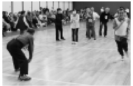
拍手と笑顔に溢れたスポーツ大会。参加したみなさんはチームを超えて互いの選手をたたえあっていました