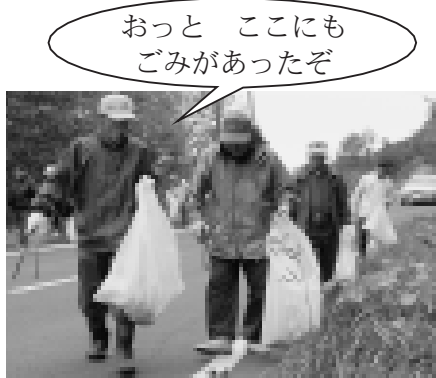
10月8日のクリーン作戦では、約1時間で軽トラックがいっぱいになるほどのごみが拾われました

10月には、1日にニセコ小学校の校外清掃が行われ、学校周辺のほか、本通団地や望羊団地などの周りのごみを拾いました。また、8日に開催された「秋のクリーン作戦」には、町内のさまざまな団体から約30人が参加し、町道羊蹄近藤連絡線沿いのごみ拾いを実施しました。そのほかにも、いくつかの自治会でごみ拾いが行われています。清掃活動に参加したみなさんお疲れ様でした。