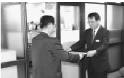
この表彰は、地域貢献活動をした事業者に対して町から感謝状を贈るもので、10月5日に新設されました

このほど、東亜道路工業株式会社北海道支社に町で初となるニセコ町建設事業者地域貢献顕彰の感謝状が贈られました。今回表彰を受けた東亜道路工業は、字中央通のサイレン坂に、景観向上と歩行者安全確保のための滑り止め景観舗装を無償で整備しました。このたびの表彰は、その活動に対して贈られました。