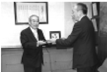
感謝状を受け取った裕理事長（左）は、「これまで感動に参加してくれたみなさん全員の功績です」と話しました