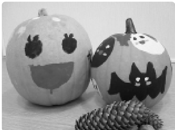
あそぶっくらぶ「黄色カボチャペイント」 黄色カボチャ落書きコンテストに向けて、 みんなで個性豊かなペイントを楽しみました