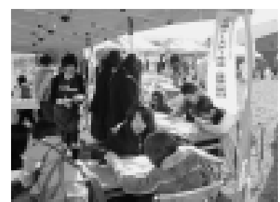
地域のみなさんとのふれあいが、私たちの「元気」の源になっています