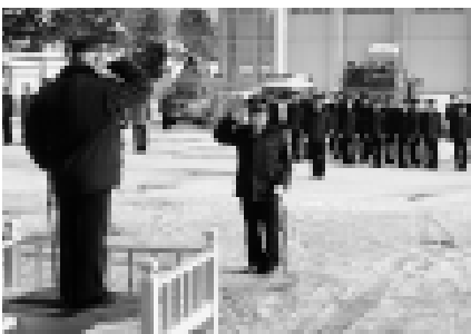
昨年の消防車両の出動は20回以上。実際の現場では、連携のとれた行動が被害拡大防止の鍵となります

今年も新年出初め式が、ニセコ消防前で行われました。式には消防職員と消防団員70人が参加し、多くの来賓が見守る中、きびきびとした動きを披露していました。厳しい訓練を積み重ねた隊員・団員のみなさんが、今年も火災から町を守ります。