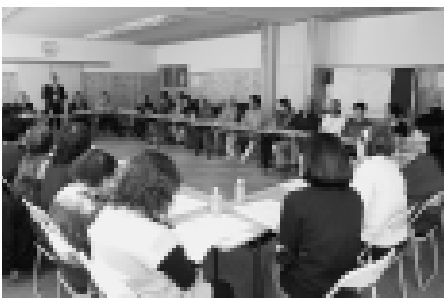
福井地区での懇談会の様子

町から—— ニセコ高校の生徒たちは、毎日町内でごみ拾いをしています。また、自分たちが使うごみステーションを、自分たちでペンキ塗りしている町内会もあります。そういう気持ちを育てるまちづくりも考えていきたいと思っています。