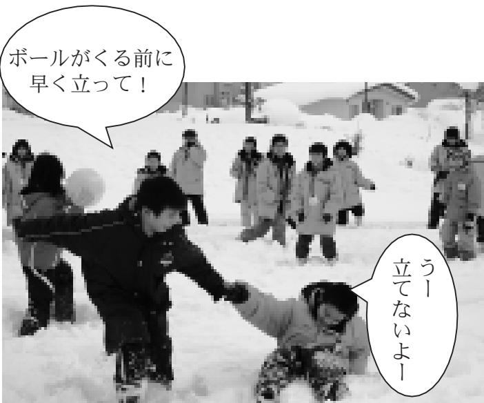
フカフカの雪に足をとられて思うように動けなかった薩摩川内市の子どもたち。それでもすぐに慣れて、ニセコの子と同じように走り回っていました

町民センターで開かれた交流会では、それぞれの町の様子や地元の方言などを紹介しました。その後会場を外に移し、雪中ドッジボールや雪中三角ベースボールを楽しみました。みなさんは、北国ならではの雪遊びを通して、お互いの交流を深めていました。