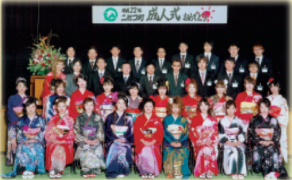
～大人としての責任感を持ち新たな時代を創っていく～晴れ着に身を包み、決意を新たにする新成人のみなさん

今回は、新成人のみなさんを紹介しします。 成人式で述べられた答辞には、新成人一人一人の強い決意が込められています。