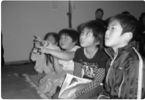
「魔法のじゅうたん」 みなさん夢中になって楽しそうにお話を聞いていました