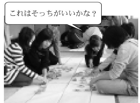
対戦前に札を並べる仕分け作業。いち早く手が出るようにするためには、札の配置も重要になります