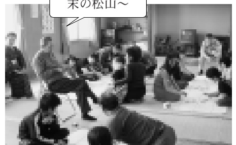
大人も子どもも同じ場で対戦した会場。年の離れた人との交流も、このかるた会の大きな楽しみの一つです

また、まだ百人一首の経験が浅い子どもたちには参加した大人の一人が講師として付いて、一枚一枚丁寧に札の読み方を教えたりルールを説明したりしていました。