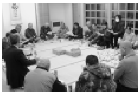
元町地区での懇談会の様子

町から商店が無くなる危機感を持っています。高齢化が進んで遠くに買い物に行けなくなったとき、隣町だけではなく、近所にもお店が必要です。商業者も高齢化が進むなか、地元のお店が将来も持続するよう応援するのが町の役割だと思っています。昨年は綺羅力一