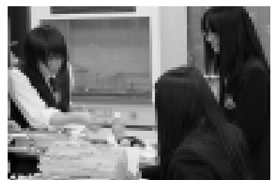
大会に向けた資料づくりの様子

成果を発表してきます。 この大会に向け休日を返上し取り組んできましたが、少しでも多くのことを伝え、取り組みの成果が出せるよう頑張ってきたと思います。