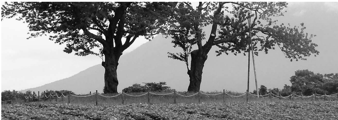
根の保護 保護柵設置による根回りの保護エリア確保