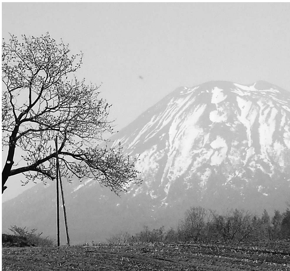
現在、保護柵で支えられているサクランボの木

広い畑の中に、寄り添うように並んだ双子のサクランボの木。その後方にそびえる雄大な羊蹄山の姿は二セコを代表する景観の一つです。この景観は、四季や時間によって表情を変え、多くの観光客や写真愛好家の人気の撮影スポットになっています。また、二セコを紹介するパンフレットや雑誌などで広く使われています。