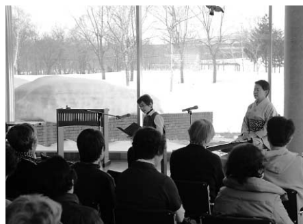
会場には町内外から多くの人が参加しました