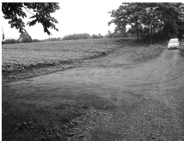
※今後も消毒作業などを行い、経過観察をしながら必要な処置を行っていきます。