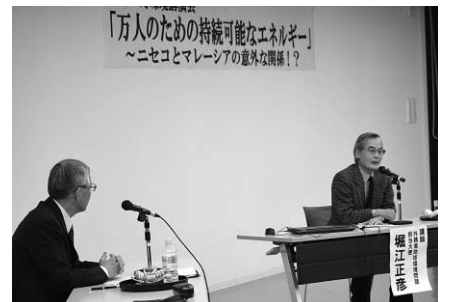
堀江さんは自身の経験を踏まえながら話してくれました