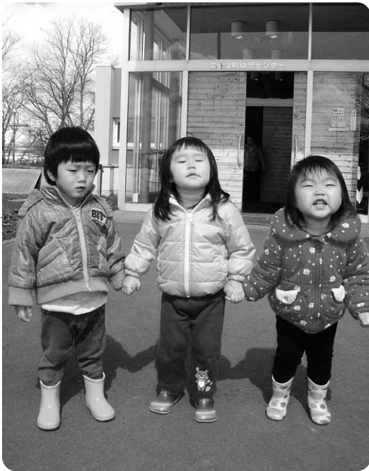
手をつないで一緒に、歩こうね