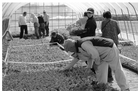
昨年もたくさんの人でにぎわいました

■場所／二セコ高校温室 ■問合せ／二セコ高校 ☎0136・44・2224 担当＝佐々木