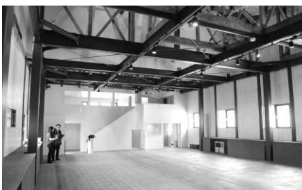
子どもから大人までみんなに親しまれる場所になってほしいですね