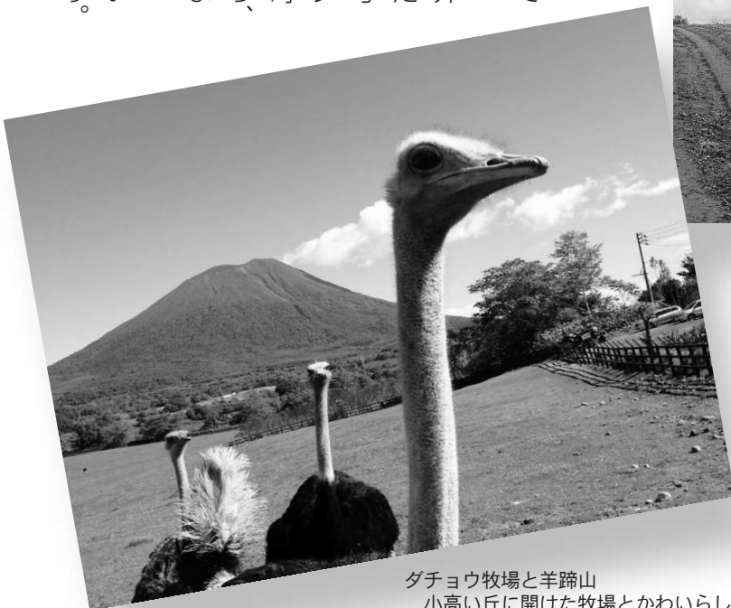
ダチヨウ牧場と羊蹄山

でも、ニセコの観光スポットにもなっているこの場所は、公有地でなく私有地なのです。