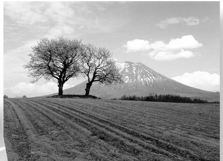
サクランボの木と羊蹄山 保護柵のない写真です（H24.5.22撮影）。多くのパンフレットなどで紹介されています。 前が畑になっていますので、決して中に入ったりしないようにご注意ください。