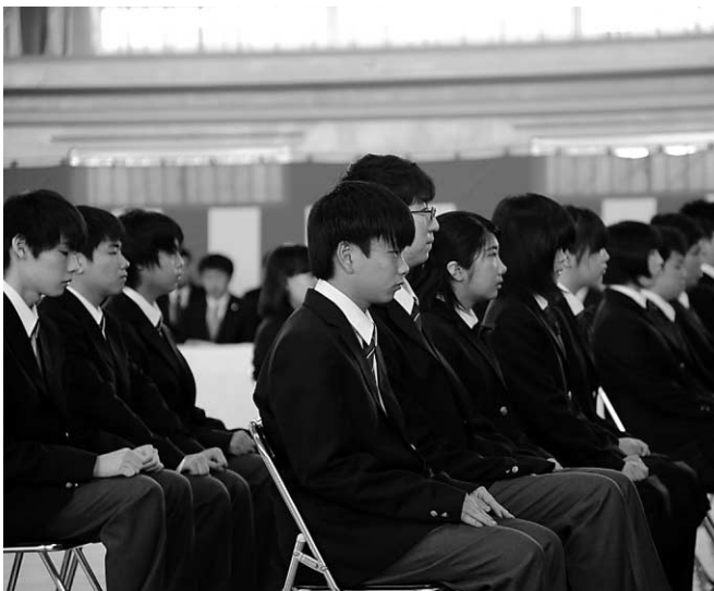
緊張した面持ちで式に参加するニセコ高校新入生

新入生のみなさん、たくさん勉強して、多くのことを経験し、楽しい学校生活をおくってくださいね。