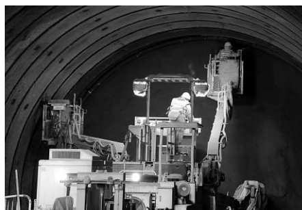
トンネルを支えるための棒が打ち込まれています

参加したみなさんは作業に使う大きな機械や実際の作業を見て、北海道新幹線の札幌延伸を心待ちにしていました。