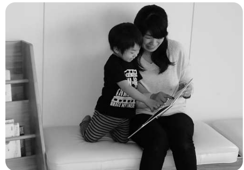
この絵本おもしろいね

「今日の給食は何かかな？」 「どんなお話読んでくれるかな？」 「どこにお散歩行くのかな？」 子どもたちの楽しみな気持ち膨らむ幼児センターでありたいと思います。