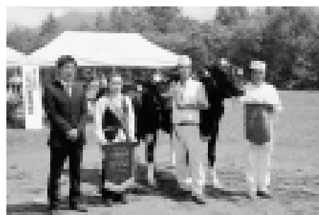
最高位賞を受賞した2頭の乳牛と生産者のみなさん

うしまつりではウサギなどの小動物とのふれあいコーナーや、乗馬体験などが開かれ、会場に集まった子どもたちは動物に触れ、動物の愛らしさを感じ、歓声をあげて楽しんでいました。