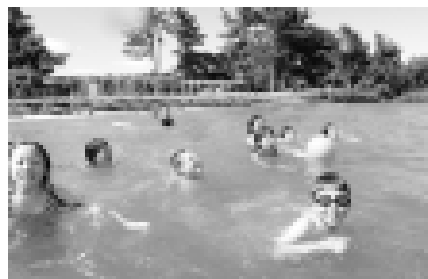
琵琶湖で湖水浴。暑さが吹き飛び、みんな笑顔です