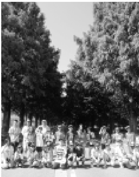
500本ものメタセコイアが2.4kmにわたって整然と並び並木道で記念撮影

キノ町との姉妹都市は解消されましたが、今後も友好関係を築くことを目的とした覚書を締結し、洋上セミナーなどの交流を続けてきています。今年の8月には、マキノ町と交流のあった人や、洋上セミナーに参加した人を中心に「マキノ交流会」が発足しました。高島市の「二セコ・マキノ会」と共に、二セコ町とマキノ地区との交流をより深める活動を行うことになっています。