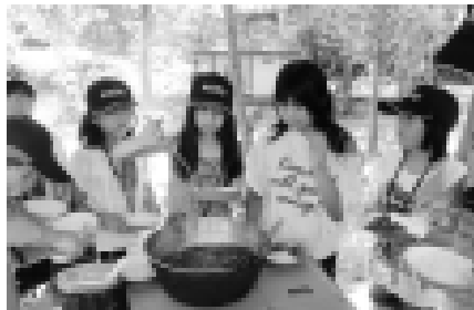
高島市の子どもたちと一緒に飯ごうを使ってご飯を炊き、カレーライスを作りました

キノ町との姉妹都市は解消されましたが、今後も友好関係を築くことを目的とした覚書を締結し、洋上セミナーなどの交流を続けてきています。今年の8月には、マキノ町と交流のあった人や、洋上セミナーに参加した人を中心に「マキノ交流会」が発足しました。高島市の「二セコ・マキノ会」と共に、二セコ町とマキノ地区との交流をより深める活動を行うことになっています。