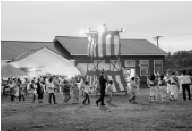
やぐらの周りに大きな輪ができ、子どもからお年寄りまで一緒に盆踊りをしました（福井地区の夏祭り）