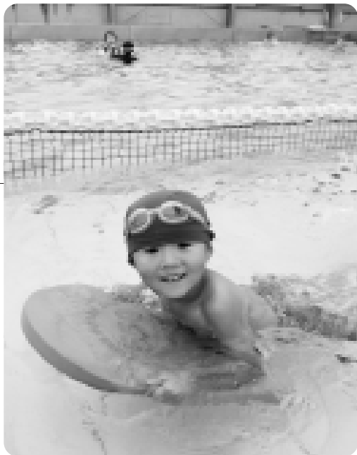
泳ぐ練習中！楽しいね～

センターのプールと違い、広いプールで泳ぐ友達の姿に刺激され、ひと夏で泳げるようになる子どもがたくさんいます。