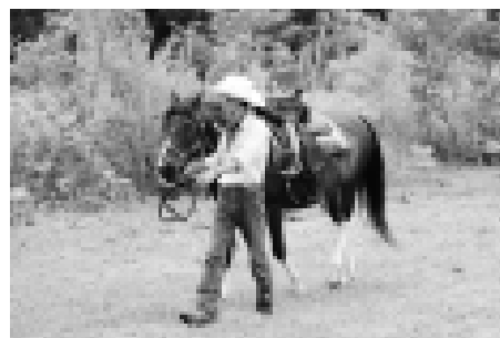
馬の上は子どもたちが思っていたより高く、景色が遠くまで見えました