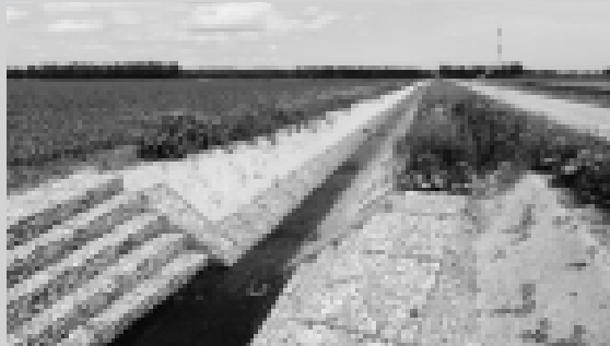
中鹿追地区で整備された排水路と農道。この地区の畑は石が多いことで悩まされていました。事業によって取り除いた石は、整備した排水路の護岸に再利用しています。このように、環境や経費にも配慮しながら農業基盤を整備しています。

二セコ町でも、次世代に優良な農地を引き継ぎ、少ない担い手でも効率的に耕作できるような農地を整備するためにも国営農地再編整備事業に取り組んでいきます。