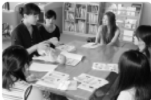
赤ちゃんが生まれてくるのが楽しみ！