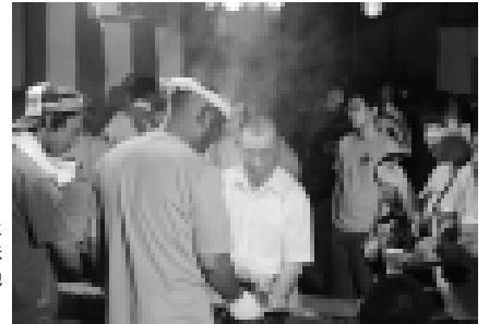
出店にはたくさんの人たちが集まり、手作りの味を楽しみました（西富地区の盆踊り）