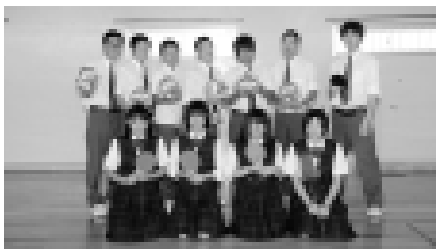
全国大会に出場したみなさん。全国大会は人生の大きな経験になったようです