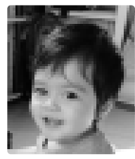
リッパー リーヴァイ 海人くん (7日) 字曾我 (リッパー ジェシーアロンさん= 有見さん) 「いつも笑顔とたくさんの 幸せをありがとう！」