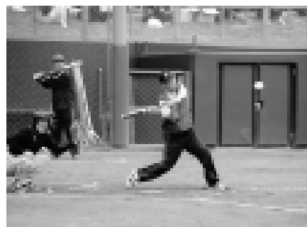
「目指せホームラン！」この一振りはチームを勝利へ導くか？