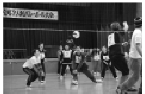
「このボールは落とさない！」全員でボールをつないだ中央チームのみなさん