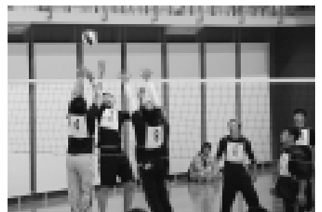
ネット際の攻防。ポイントはどちらに