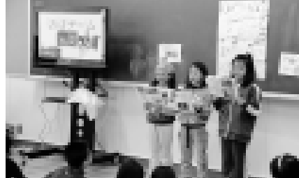
ニセコ町の一番を探した、3年生のみなさんの発表の様子

参観日に訪れたみなさんは、子どもたちの学校での笑顔や、勉強に取り組んでいる姿に、成長を感じ取っていました。