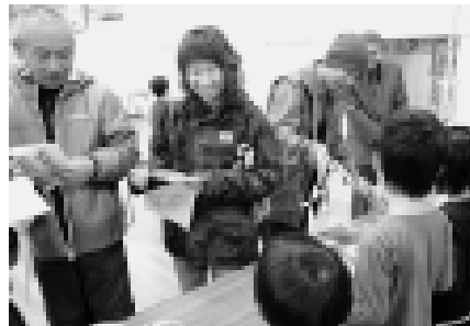
地域参観日には保護者や地域のみなさんもたくさん集まりました