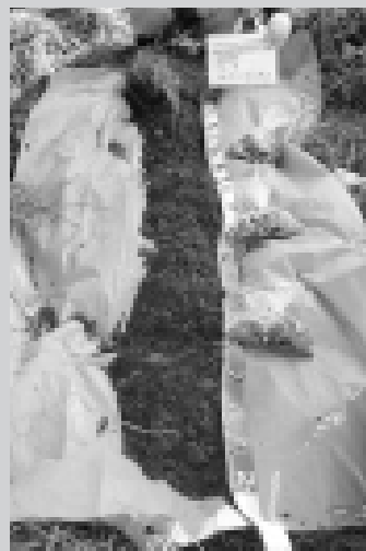
町営牧場での客土材調査の様子