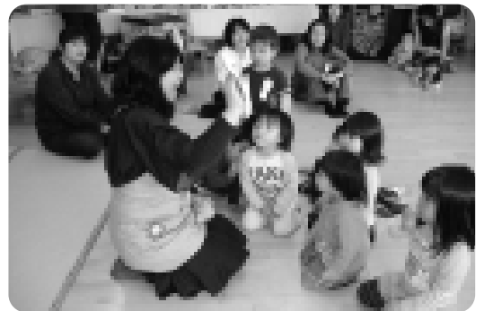
楽しく歌って遊んだよ

発表会当日は、たくさんの観客に緊張する姿も見られましたが、この大きな行事を経験することで新たな自信へとつながって行くことと思います。