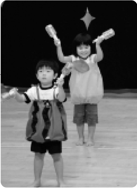
ドキドキするけど楽しいね