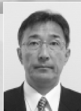
ニセコ町教育委員会教育長 菊地 博

本年もご指導・ご支援を心からお願ひ申し上げますとともに、町民みなさまのご多幸をお祈り申し上げ、新年のごあいさつとさせていただきます。