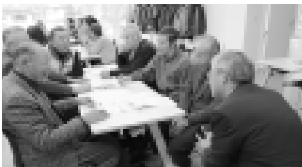
町長とざっばらんにお話をする寿大学のみなさん。懇談会は、各地域でも行なわれました

今年も、寿大学の学習会で、グループに分かれてまちづくりについて話し合いをして、町長に提案をするなど、懇談会に参加したたくさんの人から多くの意見を頂きました。