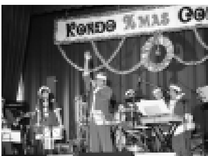
サンタクロースの衣装で揃えた、「NOMERUZU」(ノメルズ)のみなさん