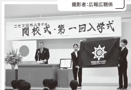
ニセコ国際高校開校式では校章が披露されました