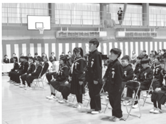
新しい制服に身を包んだ新一年生(ニセコ中学校入学式)

B・Bは1年間、町の観光大使として町内の学校や観光施設など25か所を訪れ、B・Bブログを通して町の魅力を広く発信してくださいました。たくさんの人との交流を重ね、町を盛り上げてくださり、ありがとうございました。