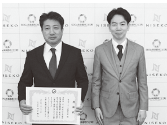
まちづくりへの貢献、ありがとうございます

学習会では、ピキニニ音楽隊による演奏が披露され、手拍子をしながら楽しむ様子が見られました。寿大学学習会ではこの1年間で、研修旅行や運動会、ゴミ拾い活動、小学生との交流など、全12回にわたりさまざまな取り組みが行われました。閉講式では、教育長(寿大学学長)や町長から1年間活発に活動された学生のみなさんへ、ねぎらいの言葉が贈られました。