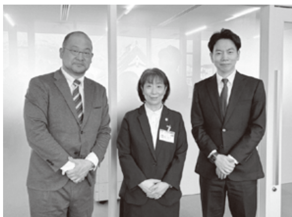
トンガでの活躍に期待しています

式の終わりには、担任の先生や保護者と一緒に最後の時間を過ごし、笑顔いっぱいの大きく成長した姿で幼児センターをあとにしました。