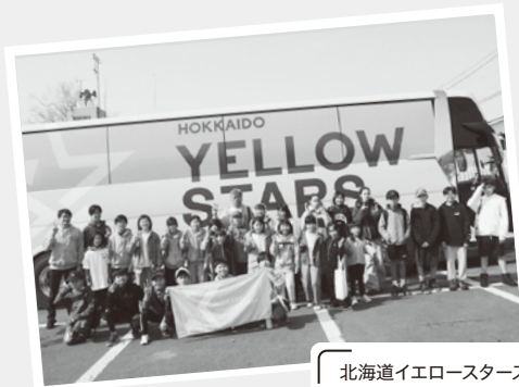
北海道イエロースターズ協力のもと、バレーボール少年団が公式戦の応援に行きました。