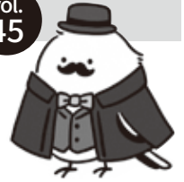
アリシマエナガ館長