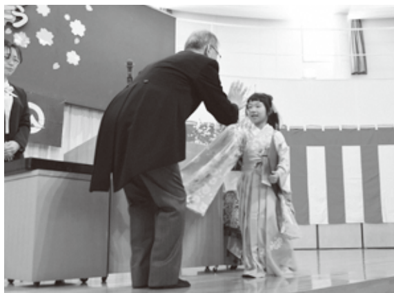
園長先生とハイタッチ!