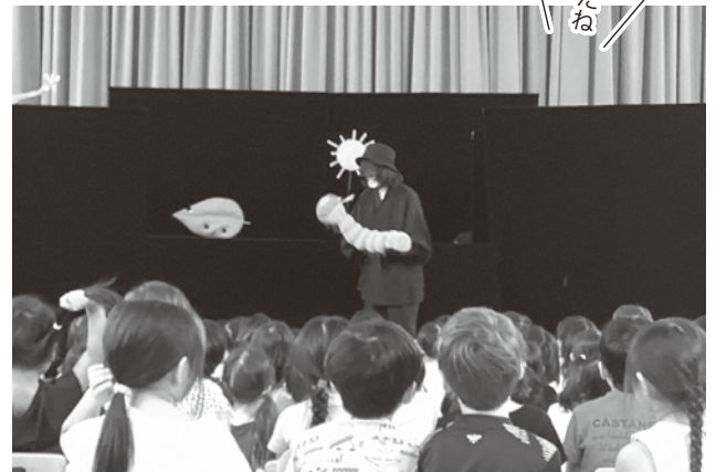
「おひさま」とは…親子で気軽に遊べて、友だち同士で悩みなどを相談できるふれあいの場所です。(幼児センター内)

はらぺこあおむしはニセコバージョンで、ニセコで収穫できる私たちの身近にある野菜などが登場しました。ほかのお話子どもたちに分かりやすく、楽しそうに見ていました。終わった後も「あおむしのお話見たよね」などと話をしていました。