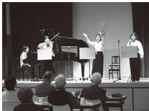
ピキニニ音楽隊による演奏

ニセコ高校における観光教育の取り組みが、国際的観光表彰制度「グリーン・デスティネーションズ・トップ100ストーリー」の「活気あるコミュニティ(Thriving Communities)部門」世界第2位に選出されました。ニセコ高校では、町や地域事業者と共に観光を通して地域を学び、地域の未来を考える教育を実施しています。ドイツ・ベルリンで行われた表彰式では、教育と地域づくりが一体となった持続可能な観光地づくりの取り組みとして高く評価されました。