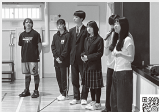
ニセコ高校・ニセコ国際高校のInstagramはこちら▶

生徒会としての任期も残り半年となりました。最後まで全力で駆け抜けていきますので、これからも応援よろしくお祈りします。