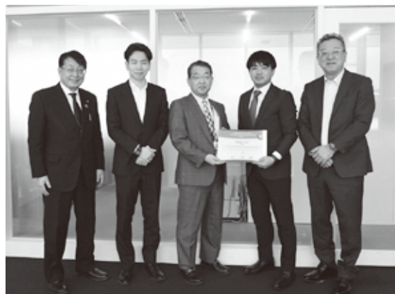
町の取り組みが世界第2位に選出