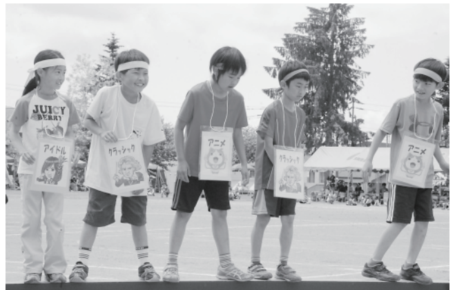
ドキドキの運命走。どのジャンルの音楽が流れるかな