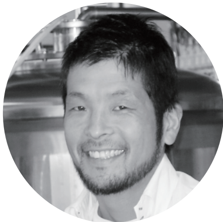
元地域おこし協力隊