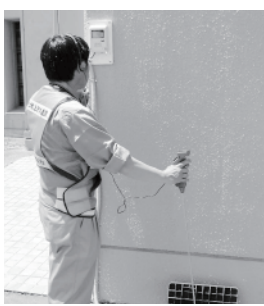
(写真1) 地下に埋設された水道メーターに伝わる振動音で漏水を確認します

住宅など、建物の周囲に埋められている水道メーターに漏水探知機を当てて調べます(写真1)。漏水探知機は、漏水時に発生する小さな振動音を検知します。1件の調査は数分で終わります。