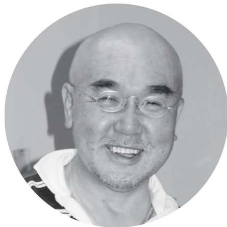
元地域おこし協力隊