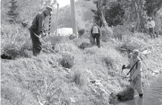
この輪がもっと広がっていけばいいですね