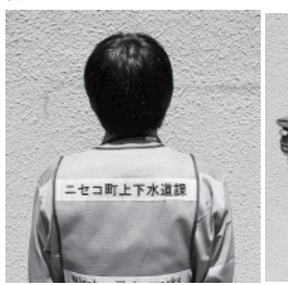
(写真2) 調査員は必ず2人一組で行動し、白色のベストを着用します。胸には町発行の身分証明書が付いています

た身分証明書を携帯していただきます(写真2)。なお、必ずお声かけしてから調査を行います。不在の場合はそのまま調査を行いますのでご理解をお願いします。