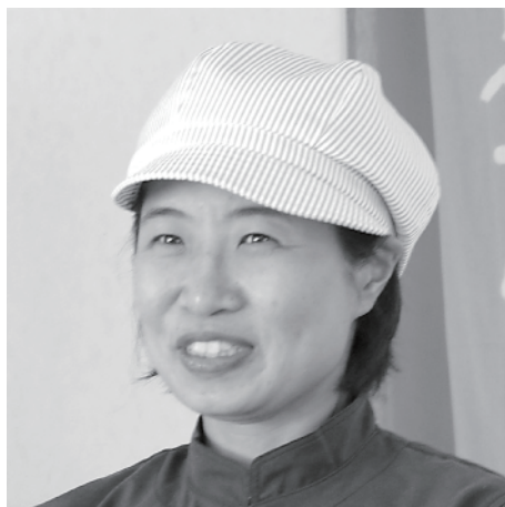
地域おこし協力隊 (東京都杉並区出身)