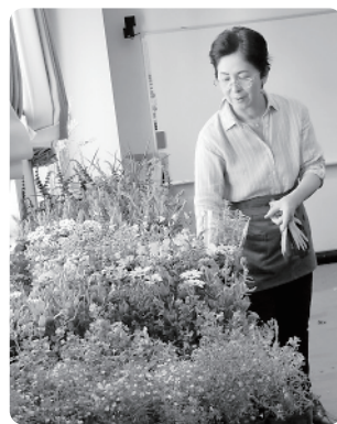
趣味の展示 『ガーデニング 春の寄せ植え』 あそぶくく館内のコミュニティールームに寄せ植え用の苗がたくさん並べられ、とても華やか。今回の寄せ植え教室も大盛況でした