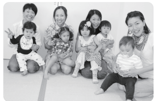
記念にみんなでハイ、チーズ!

毎年、年長児を中心に行っている畑づくりですが、今年はニセコ高校の先生にアドバイスをもらい、生徒のみなさんと子どもたちが一緒に苗植えをしました。お兄さん・お姉さんに優しく教えてもらいながらひとつひとつ丁寧に植えることができました。 これからトマトやきゅうり、とうもろこしなど12種類の野菜が大きくなるのを楽しみに待ちながら水やりや草取りを行っていく予定です。