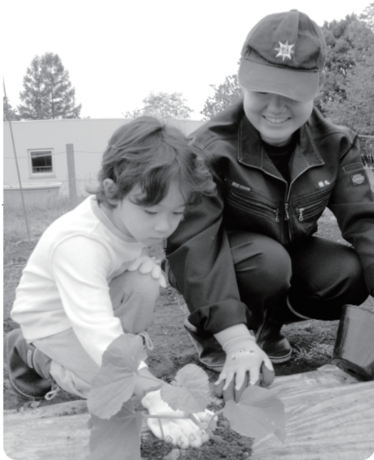
土を優しくかけてあげてね