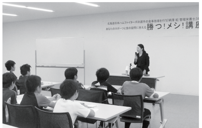
参加した子どもたちは真剣に話を聞き、メモをとっていました

少年消防クラブはこれから月1回のペースで、規律訓練や放水訓練、救助体験などの各種訓練を行います。また、来年2月の終了式までには、消防署や消防車両の見学を通じて消防の仕事や地域に密着したさまざまな活動に取り組みます。