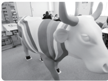
趣味の展示『カウパレード』 あそぶくくに来た時には真っ白だった牛が、色鮮やかに化粧されました。この写真から更には、子どもたちによる装飾が進んでいます。出来上りが楽しみです

●開館時間／午前10時～午後6時 ●休館日／月曜日 第4金曜日 祝日 年末年始 ☎0136-43-2155 FAX 0136-43-2156 http://asobook.sakura.ne.jp/