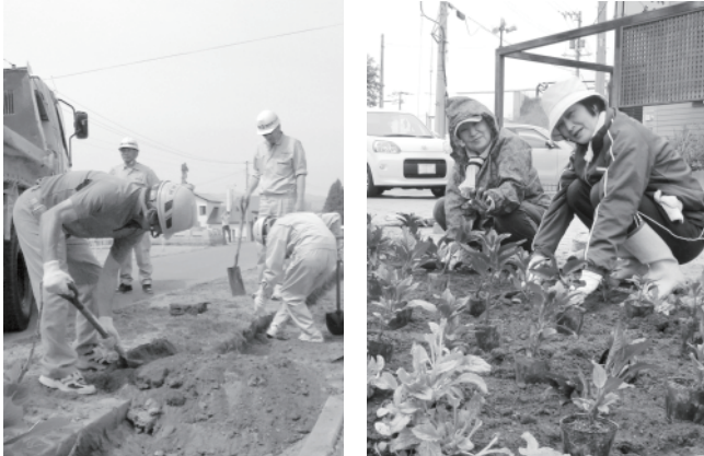
ボランティアのみなさんによって、一つひとつ丁寧に植えられます