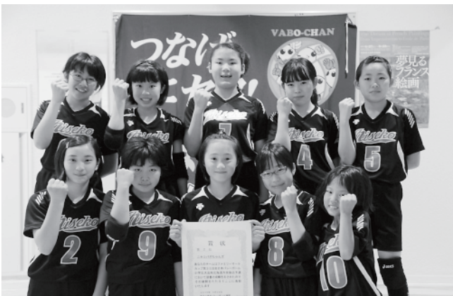
全道大会を勝ち抜けるよう一丸になって頑張ります

参加した人からは「有島灌漑溝は単なる農業用水路ではなく、文化遺産でもある。周辺にはいろいろな草花が自生している。除草剤を使わずに草刈りをして、みんなで豊かな自然を守り、水路としての役割を果たしていきたい」と話してくれました。