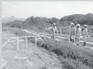
出来上りのイメージを確認

いよいよ今年度の工事が開始されますので、作業の内容を説明します。今回は現地での丁張り(木材で出来上りのイメージを作ります)確認と表土(作物の成長に適した土)の厚さの確認のようすです。まず、丁張りの確認ですが、受益者と何度も調整しながら決定した設計を基に現地に丁張りを建てます。その丁張りを現地で農家と小樽開発建設部および工事会社で確認しながら整備後のイメージを共有します。その後、畑の表土の厚さを確認して表土を畑の横に堆積してから、表土の下にあった土を動かし整備を行います。今後も工事を進める中でどのように工事を行っていくのかを進捗状況とあわせて報告していきます。