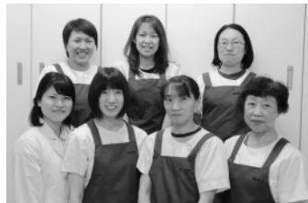
給食センターのみなさん

A. 去年の給食でわかめごはん、鶏肉の竜田揚げ、華風サラダ、お味噌汁、杏仁フルーツミック、牛乳です。