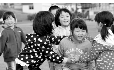
「あーつかまっちゃった」外で遊ぶのは楽しいね

元気に遊んだあとは、シートを広げて愛情たっぷりのお弁当タイム。今年も楽しい遠足となりました。