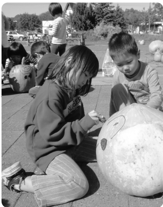
どんな顔にしようかな