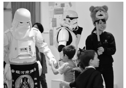
かなり本格的にコスプレする参加者もありました