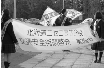
横断幕を使い、しっかりとアピールします