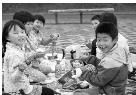
みて、みておいしそうなお弁当でしょ！