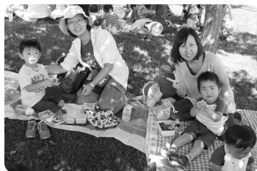
お弁当おいしいね

ハロウィンが近づくと、ニセコの街中には、大小さまざまな大きさのかぼちゃが置かれ、「大きなかぼちゃだね」と子どもたちは興味津々です。毎年、年中・年長の子どもたちは、駅前のかぼちゃに絵を描くコンテストに「かぼちゃに絵が描ける!」と喜んで参加しています。張り切って出かけマジックで思い思いの絵を描き「僕は先生をかいだよ」などと満足そうに教えてくれます。子どもたちの描いたかぼちゃを見てみませんか。