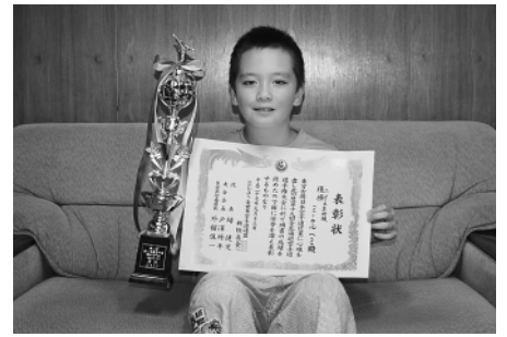
賞状とトロフィーを手にしたヘミ君