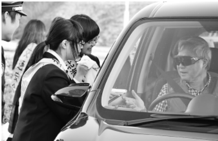
安全運転を呼びかけるニセコ高校生

高校生は、手書きした交通安全標語入りのポケットティッシュとラベンダーの苗をドライバーにプレゼントして安全運転を呼びかけていました。