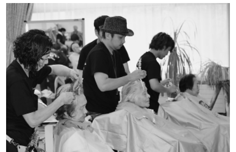
きれいにカットしてもらい気分もさわやかです