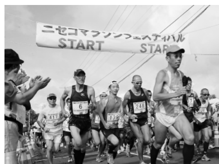
勢いよくスタートするみなさん

また、コースにさまざまな絵を描き選手を応援するロードペイントがなされ、沿道では応援フラッグを手で声援を送る町民の姿がありました。選手は応援を背に一生懸命ゴールを目指しました。