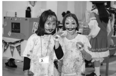
「似合ってますか」ゾンビ風メイクに挑戦しました