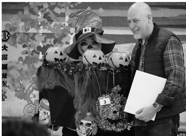
ハロウィンらしくかぼちゃになりきっています

コンテストでは、親子で衣装をそろえたり、アニメキャラクターになりきり、楽しい1日を過ごしたようです。