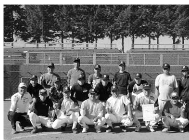
優勝おめでとうございます