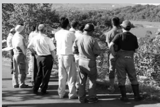
現地確認の様子（南西部工区）