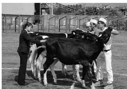
審査員の講評を受ける酪農家のみなさん

うしまつりでは、ヤギなどの小動物とのふれあいや乗馬体験、牛乳や飲むヨーグルトなどの乳製品の配布が行われ、会場に集まった子どもからお年寄りまで、みんなで楽しみました。