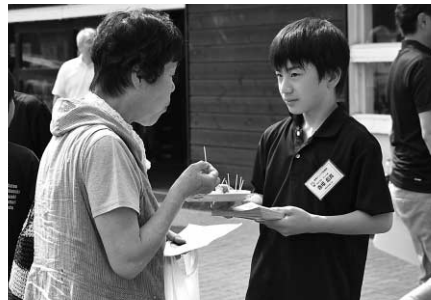
桃をPRする国見ジュニア応援団員

2日目は、ニセコビュープラザで福島県ミススピーチキャンペーンクルーと一緒に桃の販売などを行いました。桃のPRと販売にあたっては、手づくりのパンフレットの配布やハンドマイクを片手に福島の桃のおいしさを伝えていました。用意した桃100箱は完売し、国見町の応援団としての役割を果たしました。