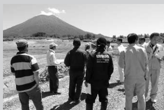
現地確認の様子（東部工区）