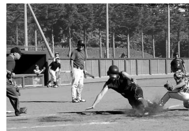
アウト？セーフ？ 判定は？