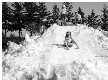
真夏に雪のすべり台。気持ちいいね