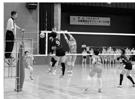
ネット際の攻防。得点はどっちに？