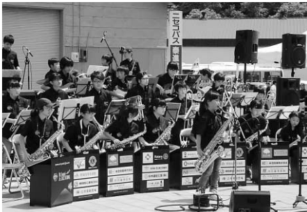
子どもたちによるジャズ演奏もありました

また、フードコーナーには、地元の農産物を使用したこだわりのお店もあり、会場は多くの人々が訪れ、年1度の「邑まつり」は盛り上がりました。