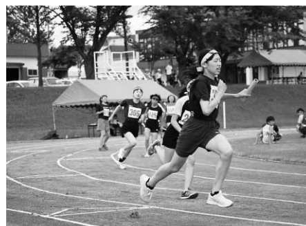
リレー競争で力走する生徒

また団体競技では、クラスの威信をかけて声援を送りながら、競技を楽しんでいました。なお、優勝は3年A組でした。