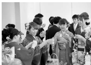
みんなでカンパイ！