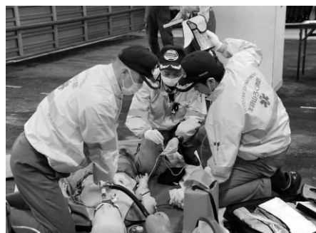
的確な措置をする救命救急士