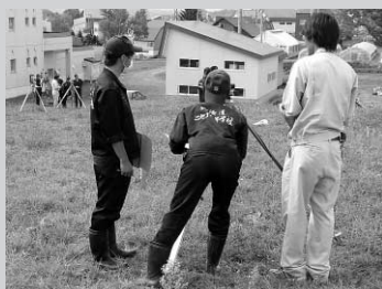
測量実習のようす

本年度、ニセコ高校から教育活動の推進のため、後志中部農業開発事業所と役場で講義を行ってきました。前回の国営レターでは、国営事業の説明、現地研修を報告しました。今回は、ニセコ高校の裏にある傾斜の敷地を国営事業のように整備をした場合にどのくらいの費用がかかるのかを実習しました。傾斜のある敷地を測量して、基盤整備の設計を行ない工事費用の積算を行ないました。今回で講義は終了しましたが、これからも国営事業の内容を多くの町民に知って貰うための広報活動も行っています。