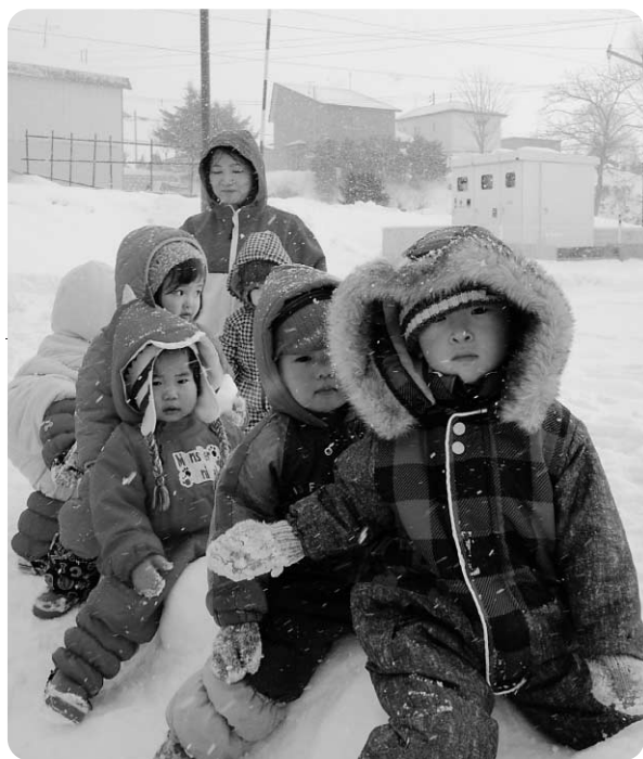
みんなで一緒に出発進行!