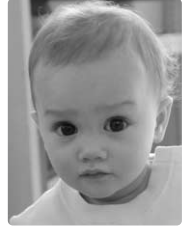
ギルフォイシエナ和凜ちゃん (13日) 字曾我 (ローレンスさん=紗奈英さん) 「1歳のお誕生日おめでとう!!!」