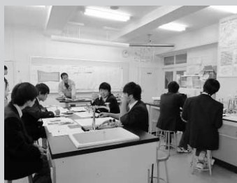
積算実習のようす