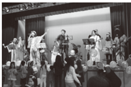
大にぎわいとなったラストステージ「人間っていいな」

オーケストラなどのステージ発表のほか、クラフト体験では段ボールや廃材で太鼓やマラカスなどを創作。和太鼓八笑とのセッションを楽しみました。また、お父さんバンド「縁も酩」とニセコ高校生の演奏で、会場は大盛り上がりとなりました。