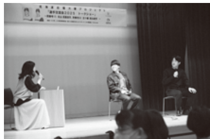
選手のお話を聞く貴重な機会となりました