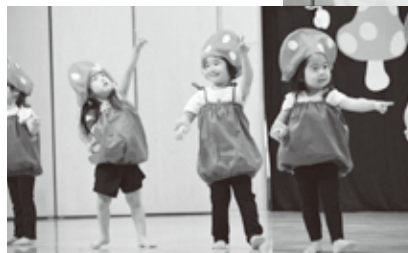
「ばくばくはんぶん」かわいらしく演じました(ひつじ組)