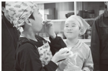
おにぎりおいしいね