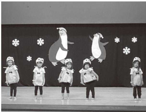
こんなに上手にできたよ！

3歳児クラスの子どもた ちにとっては初めての経験と なった発表会。ドキドキと不 安も大きかったはずですが、 泣くこともなく、たくさん 素敵な笑顔が見られました。 この大きな行事を経験す ることで、新たな自信へとつ ながっていくことと思います。