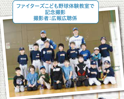
ファイターズこども野球体験教室で 記念撮影