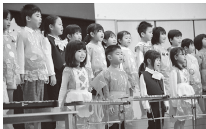
素敵な歌声を聞かせてくれました(くま組)

たくさんの練習を重ね、本番に力を発揮して発表する園児たちの姿に、会場からはたくさんのあたたかい拍手が送られました。