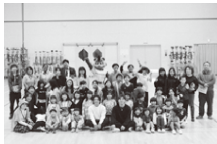
近藤小学校全校児童で記念撮影

また、学校訪問、トークショーともにニセコ町観光大使のB・Bも参加。選手やファンなど、たくさんの人が交流する貴重な時間を過ごしました。