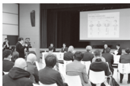
田中町長がパネリストとして参加

町内からは観光事業者やニセコ高校生などが参加。事例の紹介も交えた基調講演などを通し、旅行者が旅行に求める価値を考え、町の観光のこれからを考える機会となりました。