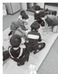
昨年の「かるた」遊びの様子

小学校の冬休み中、「あそぶっくらぶ」はお休みです。次回は1月22日、正月遊びです。予約はいりませんので、午後3時までにあそぶっくに遊びに来てください。