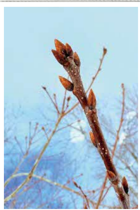
春を待つ冬芽(ミズナラ)

身近な写真を広報で紹介してみませんか。撮影日や撮影場所などの簡単な説明とお名前(フォトネーム)とともに、広報広聴係(koho@town.niseko.lg.jp)までお寄せください。ニセコ町公式LINEの投稿フォームからも投稿できます。