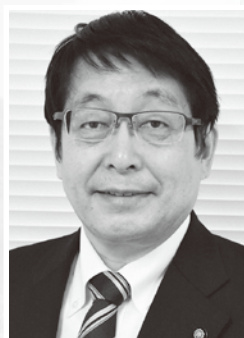
ニセコ町教育委員会 教育長