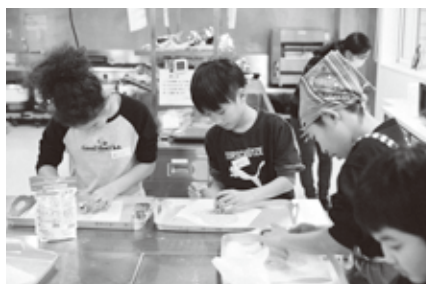
クッキーの型抜き楽しいね

「食品ロスについて学ぼう」をテーマに、ニンジンを使ってカップケーキとクッキーを作りました。材料には、商品にはならない規格外のニンジンを使用。どうしたら食品ロスが減らせるか、家でも自分にできることがあるか、みんなで考えました。