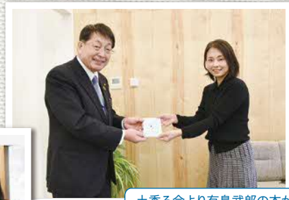
土香る会より有島武郎の本が 寄贈されました