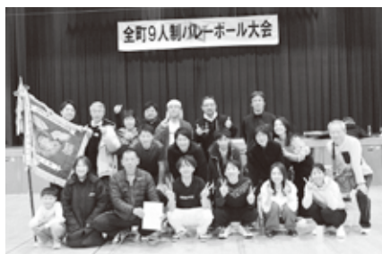
見事優勝した東部チームのみなさん