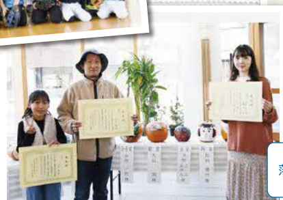
黄色かぼちゃ 落書きコンテスト表彰式