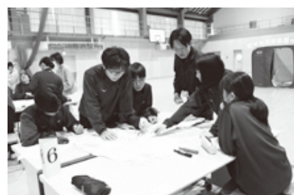
みんなで意見を出し合いながら進めます

防災職員による講話では、避難所運営で大切なことやフェイクニュースなどについて紹介され、地域防災への理解を深めました。