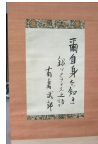
『有島武郎の自筆書幅』