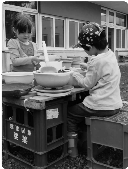
どんな料理ができるかな？