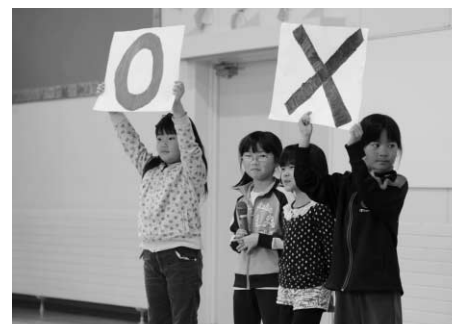
3年生のO×クイズで大盛り上がり