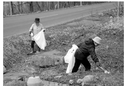
たくさんのゴミを拾いました

町内にはこれからたくさんの観光客が訪れます。気持ちよく観光してもらうためにも、ゴミのポイ捨ては絶対にやめましょう。