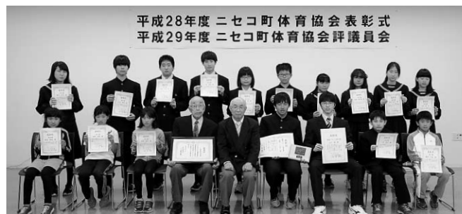
受賞された22人のみなさん、おめでとうございます