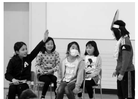
4年生は生活のルールを教えてくださいました