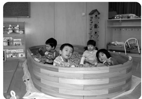
木の砂場で遊ぶの楽しいね！

夏の遊びが始まり、砂場遊びの中で子どもが自主的に遊びを展開できるような環境を整えていこうと職員で話し合っています。これまでは頂いたコードリールをテーブルにしてみました。子どもたちがもつとじっくり遊びこめるように今年は高さのあった椅子とテーブルを廃材を利用して増やしてみました。子どもが使いやすい、遊びが楽しくなるような環境をこれからも考えていきたいと思っています。