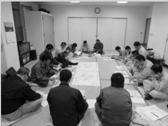
曽我地区推進委員会のようす

これからも来年度以降の計画的な事業促進に向けて、中央省庁への要請活動なども行っていきます。