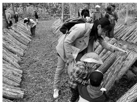
しいたけ収穫のようす