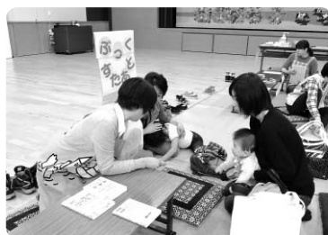
『ブックスタート』 町の乳幼児健診会場にて。会場で 順番待ちの赤ちゃんとお母さんにも 一緒に読み聞かせの楽しさを体感し てもらっています。