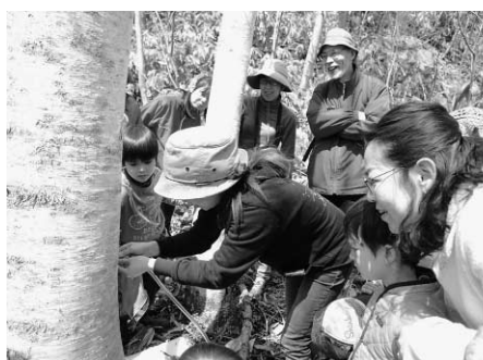
木に穴をあけたら樹液が出てきました

第3回は町内元町地区で、しいたけの植菌と収穫をしました。原木に菌を植えてほだ木をつったり、大きなしいたけをたくさん収穫したりして、大人から子どもまで、夢中で作業をしていました。今回植菌したしいたけは、秋になったらまたみながら収穫します。