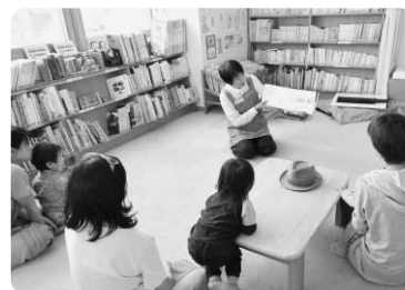
『ちいさいおうち』 絵本の読み聞かせを楽しむ子どもたちとスタッフの様子。今回はどんなお話が聞けたかな？