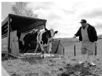
動いてくれない牛を必死にひっぱります