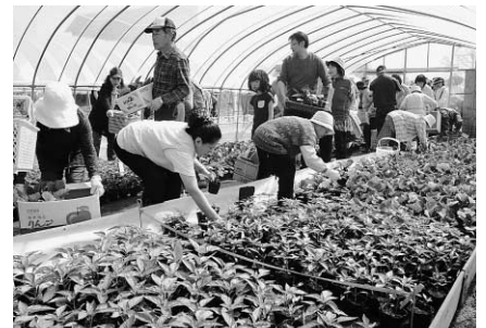
どの苗にするか、真剣に選んでいます

今年度は花苗20種、野菜苗12種が用意され、人気のある苗は売り切れが出るなど、大盛況でした。