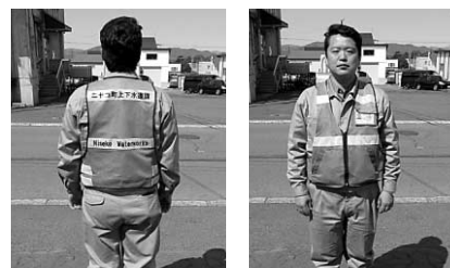
(写真2) 調査員は必ず二人一組で行動し、水色のベストを着用します。胸には町発行の身分証明書が付いています