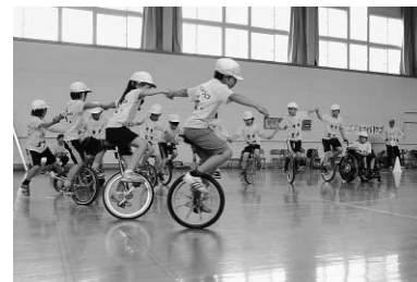
見事な一輪車を披露した近藤小の児童