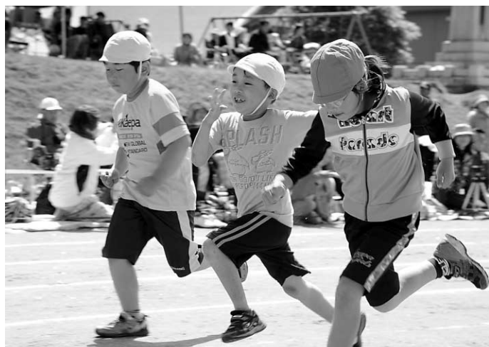
全力で走った徒競走（ニセコ小）

ニセコ小学校では、肌寒い天気となりましたが子どもたちはへっちゃらな様子で、競技に全力で取り組む姿をみせてくれました。勝負は最終競技の4色対抗リレーまでわからないほどの接戦となり、児童だけでなく、駆けつけた家族のみなさんまで、応援に力が入りました。