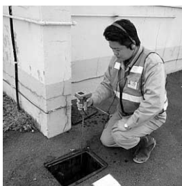
(写真1) 地下に埋設された水道メーターに伝わる振動音で漏水を確認します

住宅など、建物の周囲に埋められている水道メーターに漏水探知機を当てて調べます（写真1）。漏水探知機は、漏水時に発生する