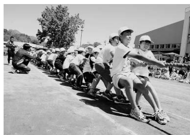
綱引きは白熱した戦いとなりました（ニセコ小）