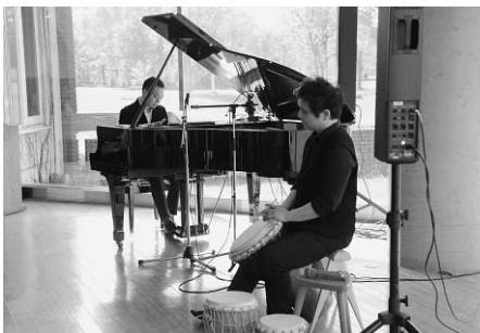
素晴らしい演奏が会場に響き渡りました

コンサートの最後には、有島武郎をイメージした即興曲が披露され、アンコールも行われるなど、会場が一体となって盛り上がりました。