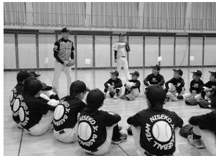
コーチの話をしっかりと聞く子どもたち