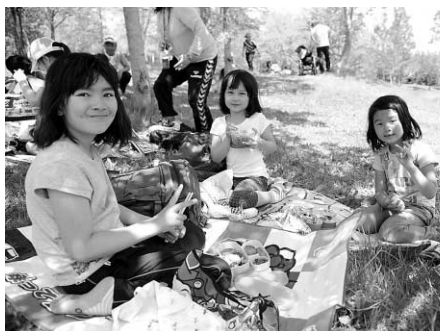
外で食べるお弁当はおいしいね

お昼の時間には、お弁当をおいしそうに頬張りながら食べていました。それぞれ持ち寄ったおやつは、友達と仲良く分け合っていました。