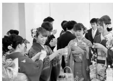
みんなでカンパイ！