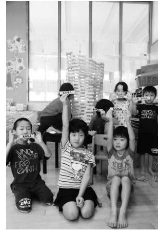
こんなに大きくできました！

子どもたちは「すごく楽しい。もっと遊びたい」や「建物を作ったので、次は乗り物を作りたい！」などの感想も聞かれ大好評でした。