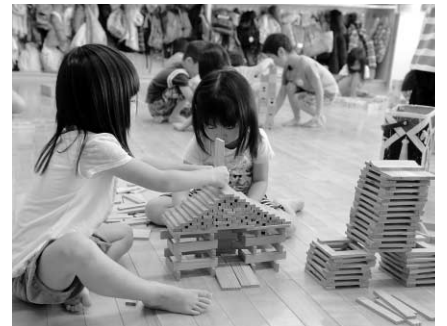
大人顔負けの作品ができました