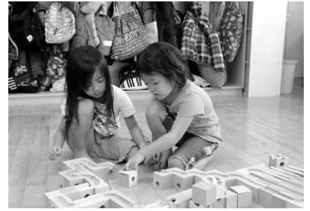
どこをどうつなげたら通るかな？相談しながら作ります