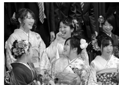
久しぶりに会う友だちとの会話も弾みます