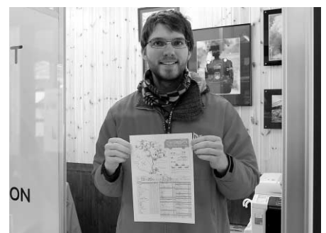
国際交員もニセコ駅でおもてなしをしています

このバスは期間中1日3便運行し、JRニセコ駅からホテルやスキー場などを往復しています。町民のみなさんも是非ご利用ください。