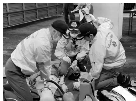
的確な措置をする救命救急士