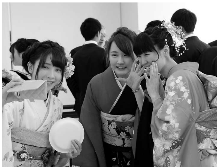
ハイ！チーズ！祝賀会ではみんなで写真を撮り合っていました

式典後の祝賀会では、中学校時代の同窓会の雰囲気や中学生時代の先生と思い出話をしたり、写真を撮りあうなどして、久しぶりに会う友人との再会を楽しんでいました。また、中学時代の先生も交えて今の自分の目標や近況を報告しあいました。