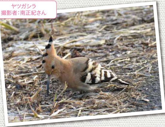
ヤツガシラ

身近な写真を広報で紹介してみませんか。撮影日や撮影場所などの簡単な説明とお名前(フォトネーム)とともに、広報広聴係(koho@town.niseko.lg.jp)までお寄せください。ニセコ町公式LINEの投稿フォームからも投稿できます。