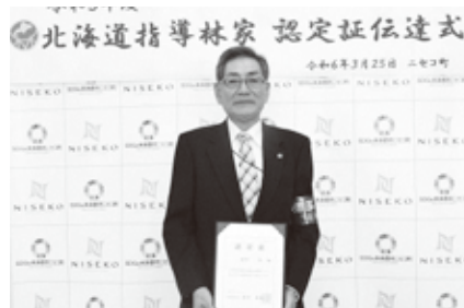
豊かな森林を後世へつなげるために

これまで「ニセコ森と緑の会」を設立し、初代会長として町民を対象とした森林観察会を開催するなど、地域と一体となった活動を実施しました。