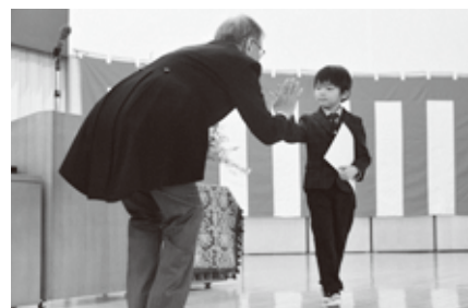
緊張しながらも元気よくハイタッチ!