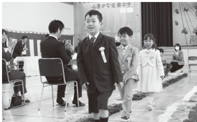
これからよろしくね！（近藤小）

ニセコ小学校では、担任の先生に名前を呼ばれると手を挙げて元気よく返事をしていました。近藤小学校では、上級生に手をつながれて新入生が入場。ニセコ中学校とニセコ高校では、新入生代表が、これからの学校生活への抱負を述べました。