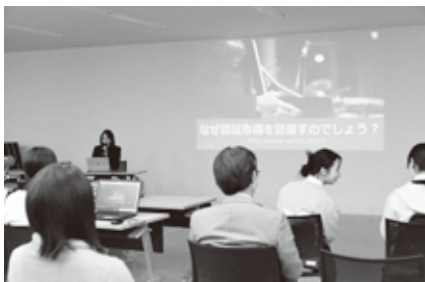
持続可能な観光地づくりの大切さを学びました

昨年10月に観光地の国際認証団体「グリーン・デスティネーションズ」より、シルバーアワードを受賞したことを報告。また、ニセコ高校生が「持続可能な観光教育とGSTC」をテーマに、学校での取り組みを発表しました。さらには、今回のGSTCの認証にご尽力いただいた4人によるパネルディスカッションも行われ、今後の観光地づくりについて討論が行われました。