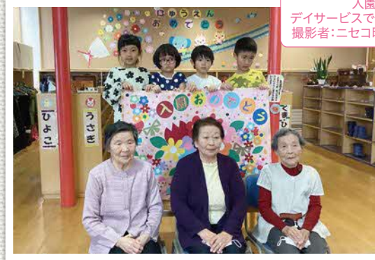
入園おめでとう! デイサービスで作った力作をプレゼント