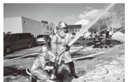
訓練に励む団員たち

この日は、建物火災を想定し、ホース延長や中継訓練などといった火災時の動きが確認され、消防職団員は寒空の中、真剣な表情で訓練に臨んでいました。