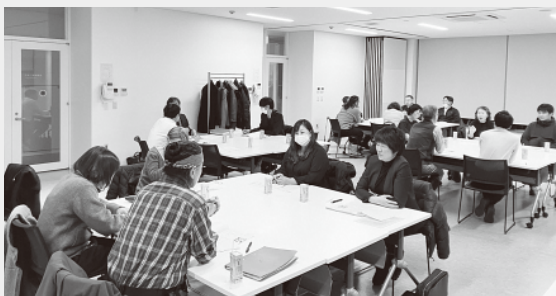
■問合せ／コミュニティ・スクール委員会事務局 ニセコ町教育委員会 TEL 0136-44-2101

令和5年度は、総合的な学習の時間の講師、浴衣の着付け体験、国際交流授業の支援など、15事業で学校支援ボランティアが活躍しました。登録しているみなさんには、学校の依頼に応じて、「できるひとが・できるときに・できることを」お願いしています。新規のボランティアさんも募集していますので、詳しくは下記までお問い合わせください。