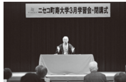
熊八氏の落語の世界に引き込まれます

閉講式では、寿大学でこの1年間に行われた、老人クラブ合同研修旅行や運動会などさまざまな学習会を振り返りました。