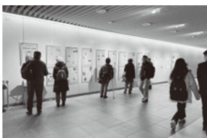
多くの方が足を止めてパネルを読んでいた