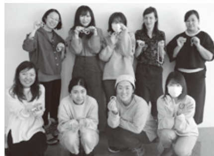
とても素敵なアクセサリーが出来ました！！