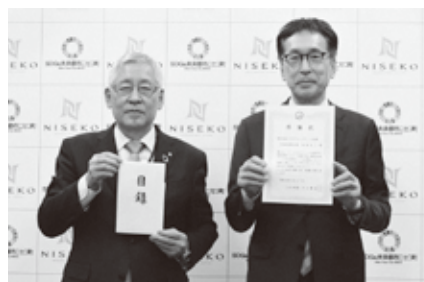
よりよい地域づくりに努めます

相茶社長は、「オーバーツーリズムの解決など、観光で得られる恩恵が地域の人に還元されていく仕組みづくりなどに役立ててほしい」と話しました。