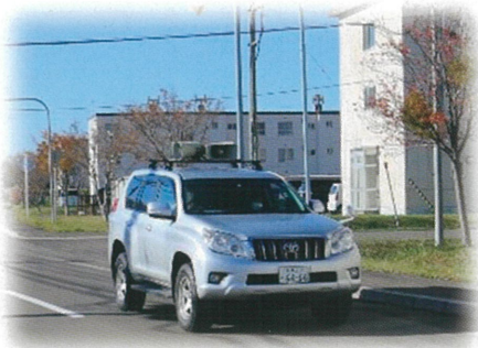
広報訓練 （広報車による広報）