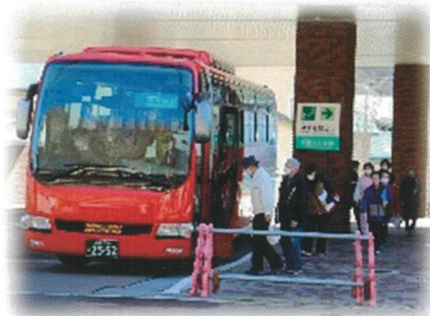
住民避難等訓練 （バスによる避難）