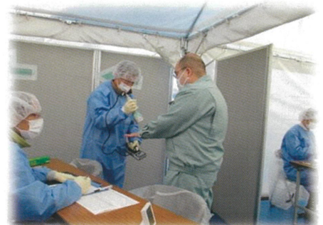
原子力災害医療活動訓練 （避難退域時検査）